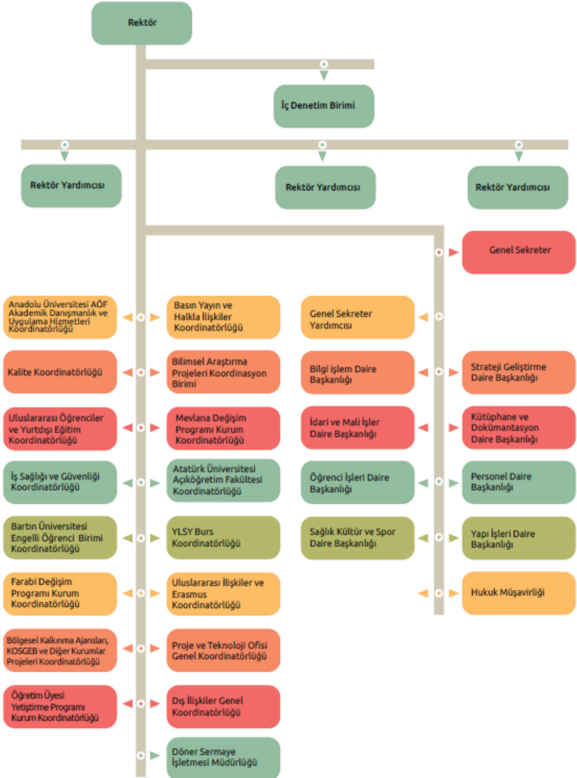
Şekil 2. İdari Teşkilat Şeması