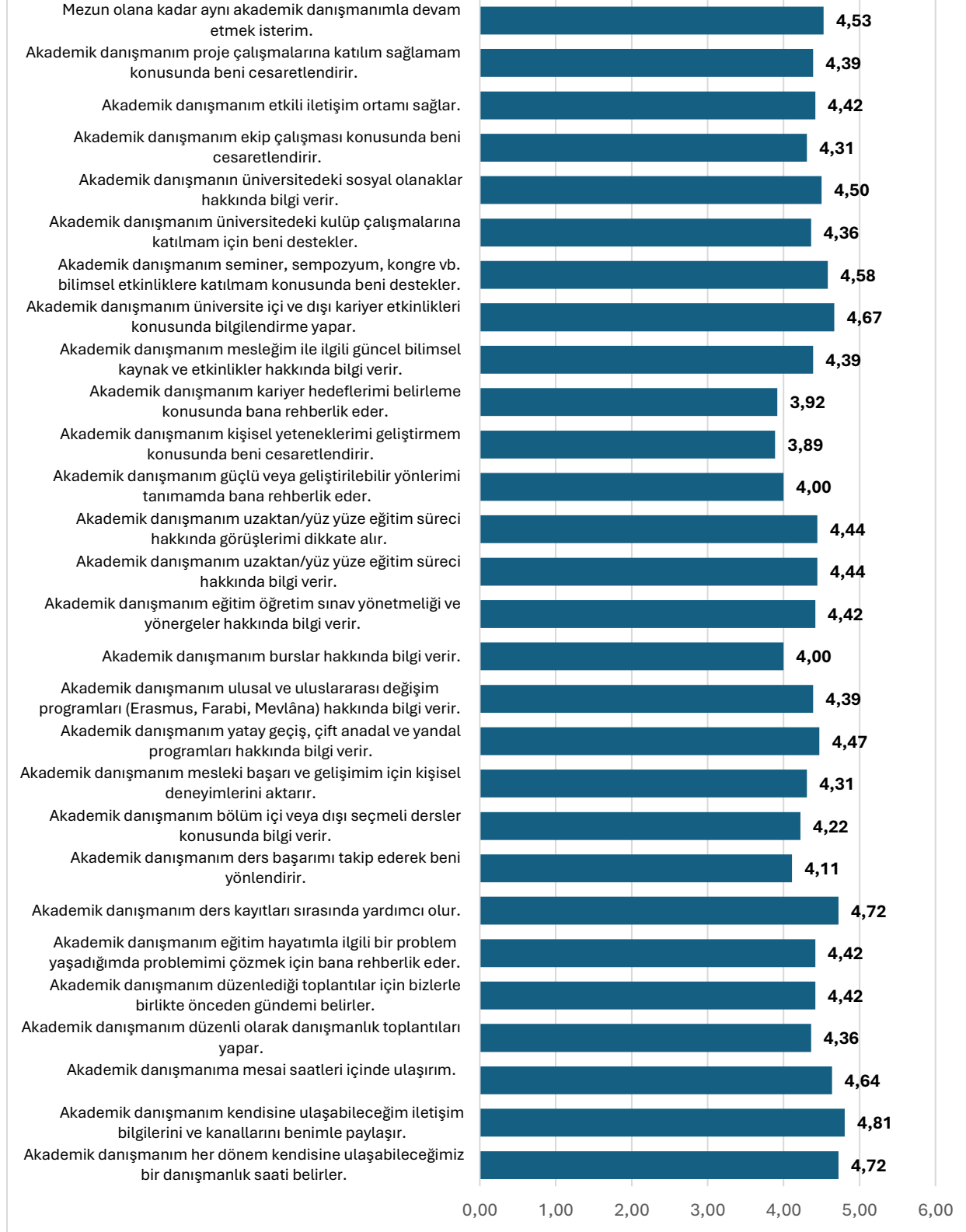
Grafik 4: Danışman-3