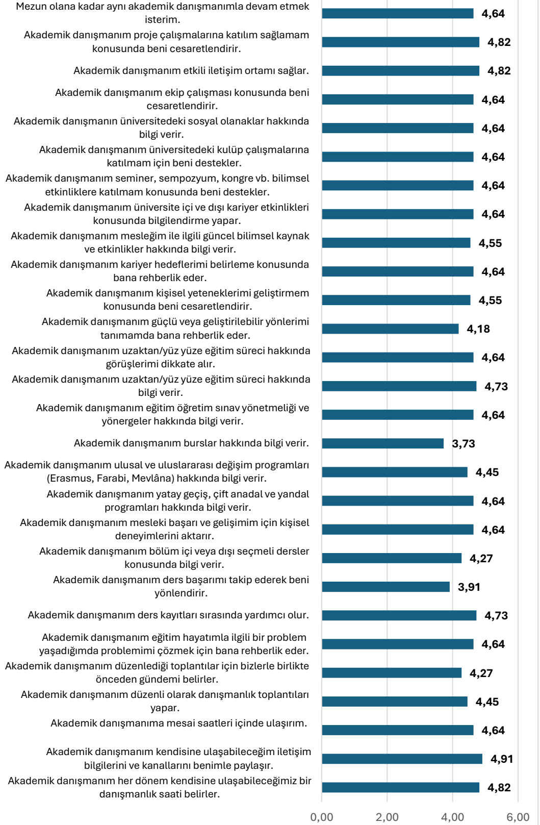
Grafik 5: Danışman-4