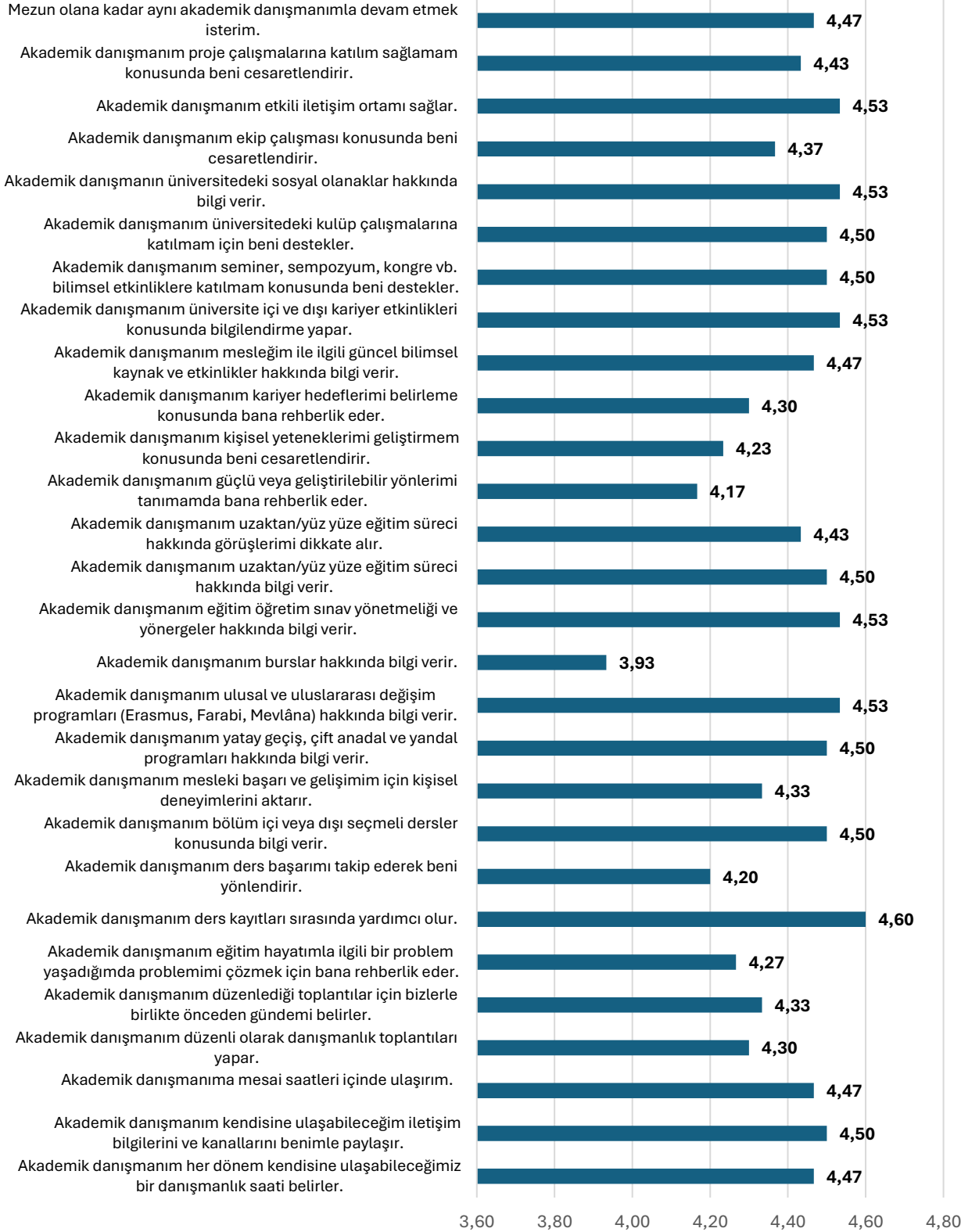
Grafik 3: Danışman-2