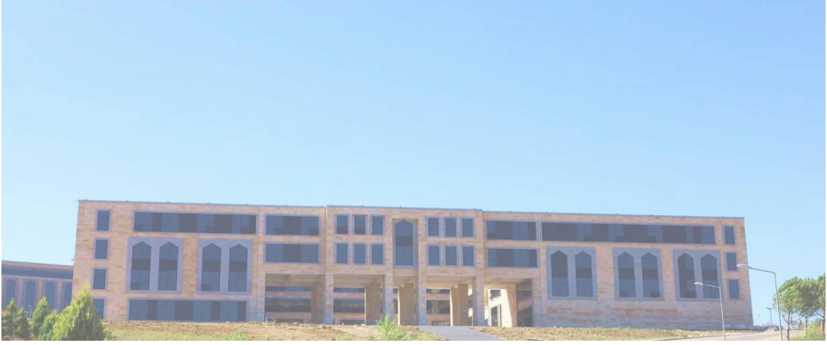
Resim 3: Bartın Üniversitesi İktisadi ve İdari Bilimler Fakültesi