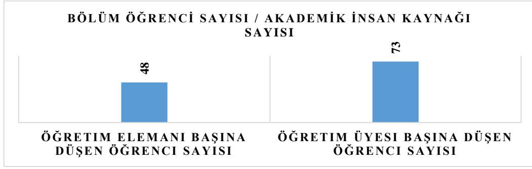
Grafik 2: Akademik İnsan Kaynağı Başına Düşen Öğrenci Sayıları

2018-2019 akademik yılı itibariyle öğrenci alımına başlayan bölümümüzün yıllara ait öğrenci sayısı aşağıdaki Grafik 3'te verilmiştir. Grafiğe göre en az öğrenci sayısı eğitime başlanılan yıl olarak kabul edilen 2018 yılında gerçekleşirken en fazla öğrenci sayısı 2023 yılında gözlemlenmiştir.