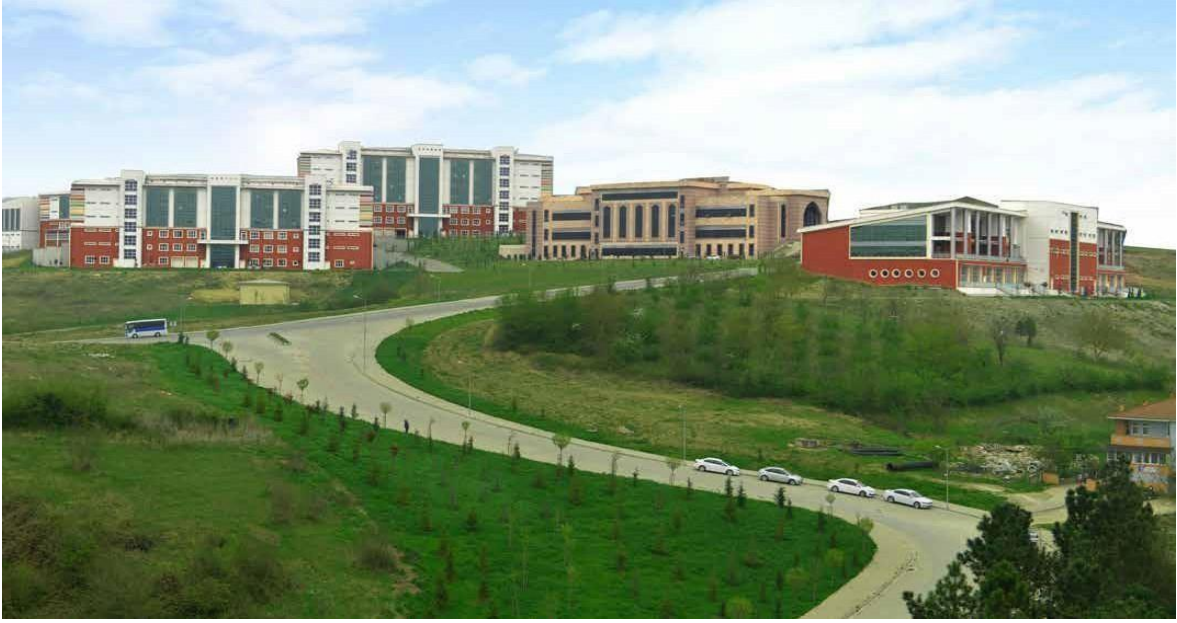
Resim 2: Kutlubey Yerleşkesi

Uluslararası Ticaret ve Lojistik Bölümü, Bartın Üniversitesi İktisadi ve İdari Bilimler Fakültesi, 5765 sayılı kanunun 31 Mayıs 2008 tarih ve 26892 sayılı Resmî Gazete 'de yayınlanmasıyla 2018-2019 eğitim-öğretim döneminde kurulmuştur. Bölümümüz 2018-2019 akademik yılından itibaren öğrenci alımına başlamıştır.