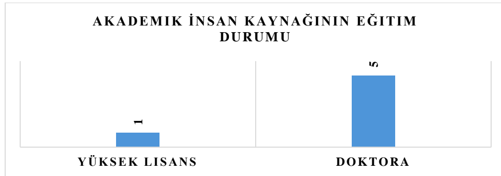
Grafik 1: Akademik İnsan Kaynağının Eğitim Durumu

Bölümümüzde görev yapan akademik insan kaynağının eğitim durumları Grafik 1'de gösterilmiştir.