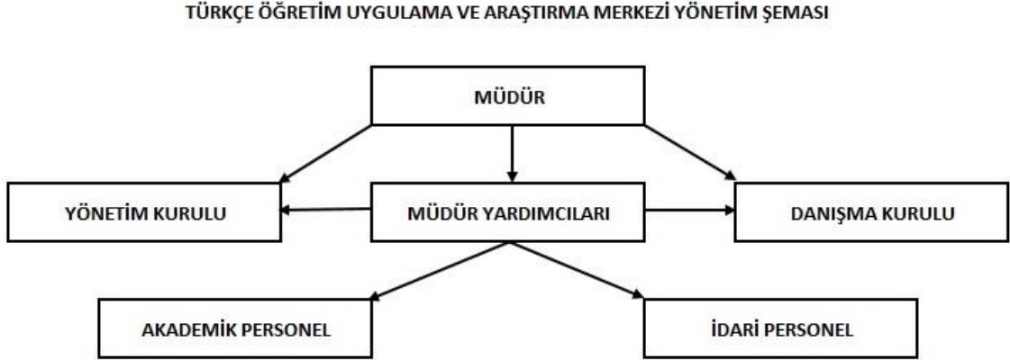
Şekil 1 Teşkilat Şeması