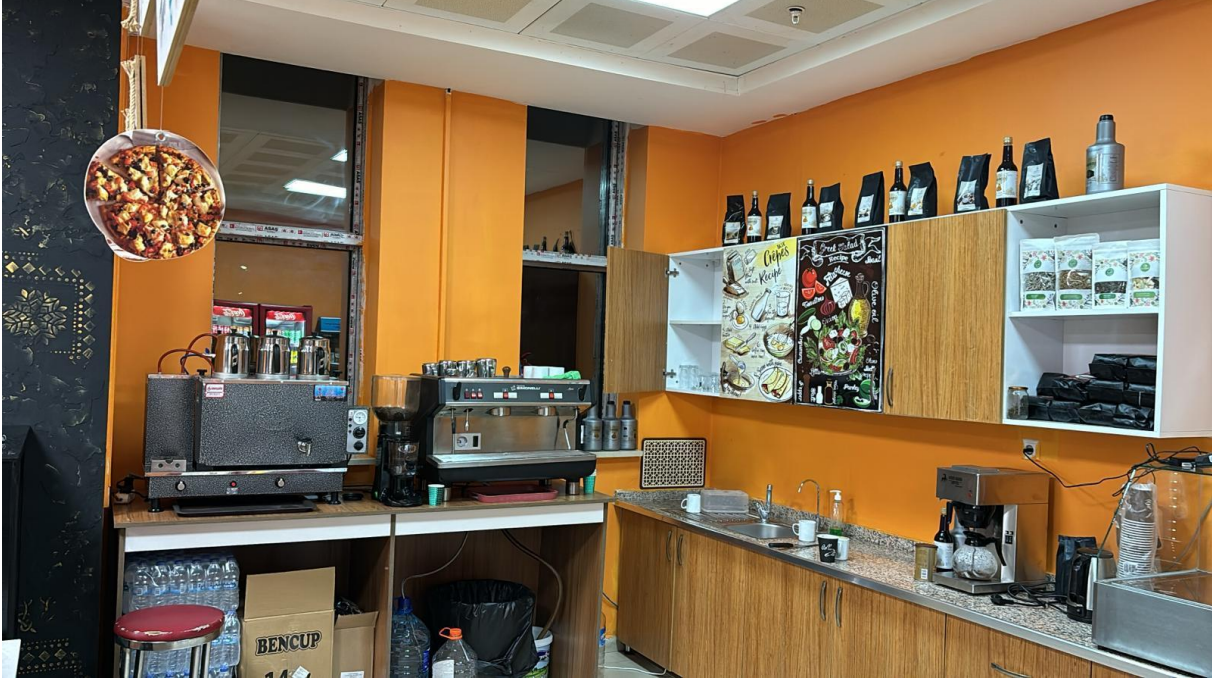
Resim 8 Kafeterya