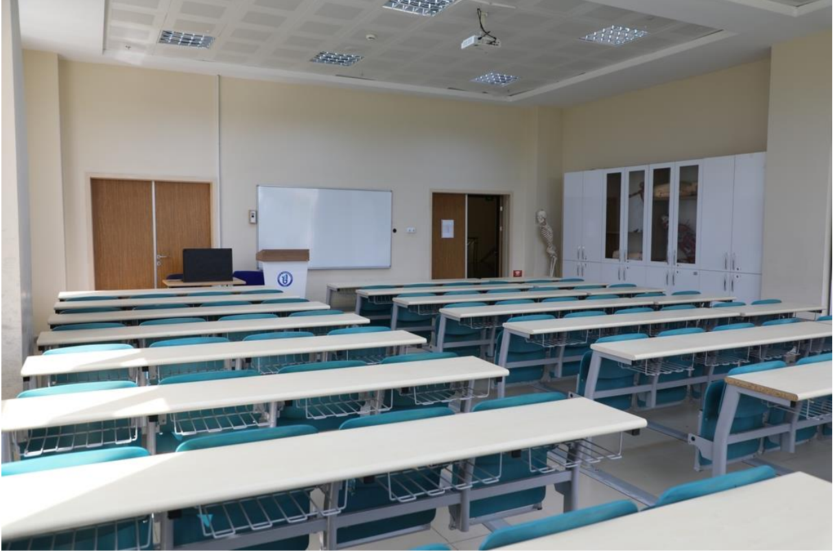
Resim 2 Derslik