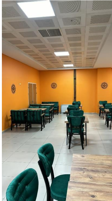
Resim 10 Kafeterya