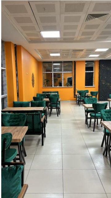
Resim 9 Kafeterya