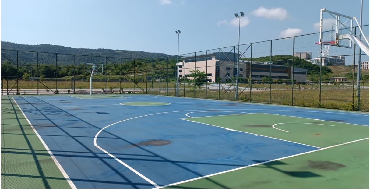
Resim 4 Açık Alan Basketbol Sahası