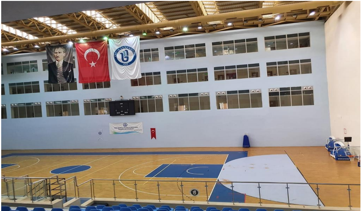
Resim 5 Kapalı Alan Çok Amaçlı Spor Salonu