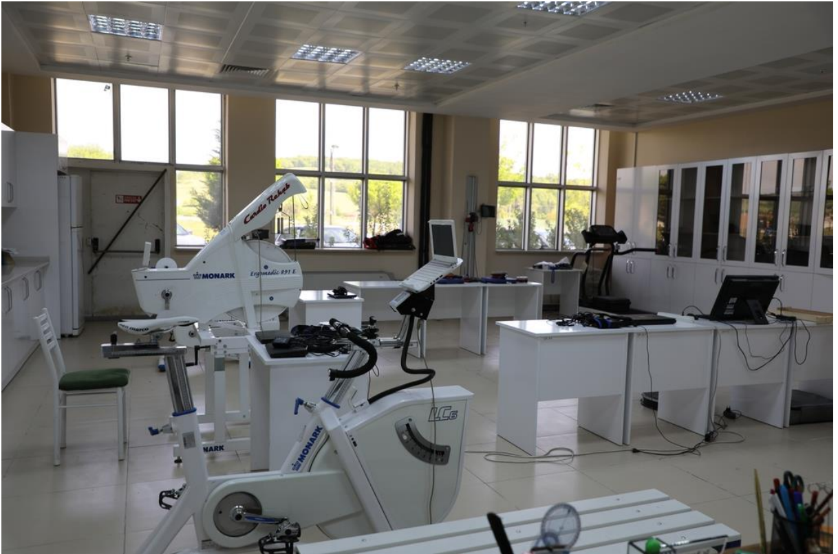
Resim 7 Egzersiz Fiziyojisi ve Performans Laboratuvarı