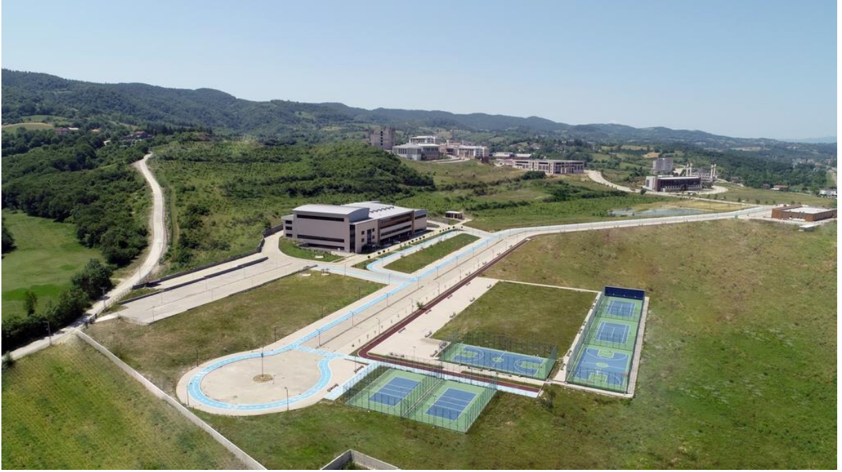
Resim 1 Fakültemizin Dışardan Görünümü