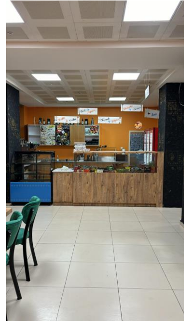
Resim 11 Kafeterya