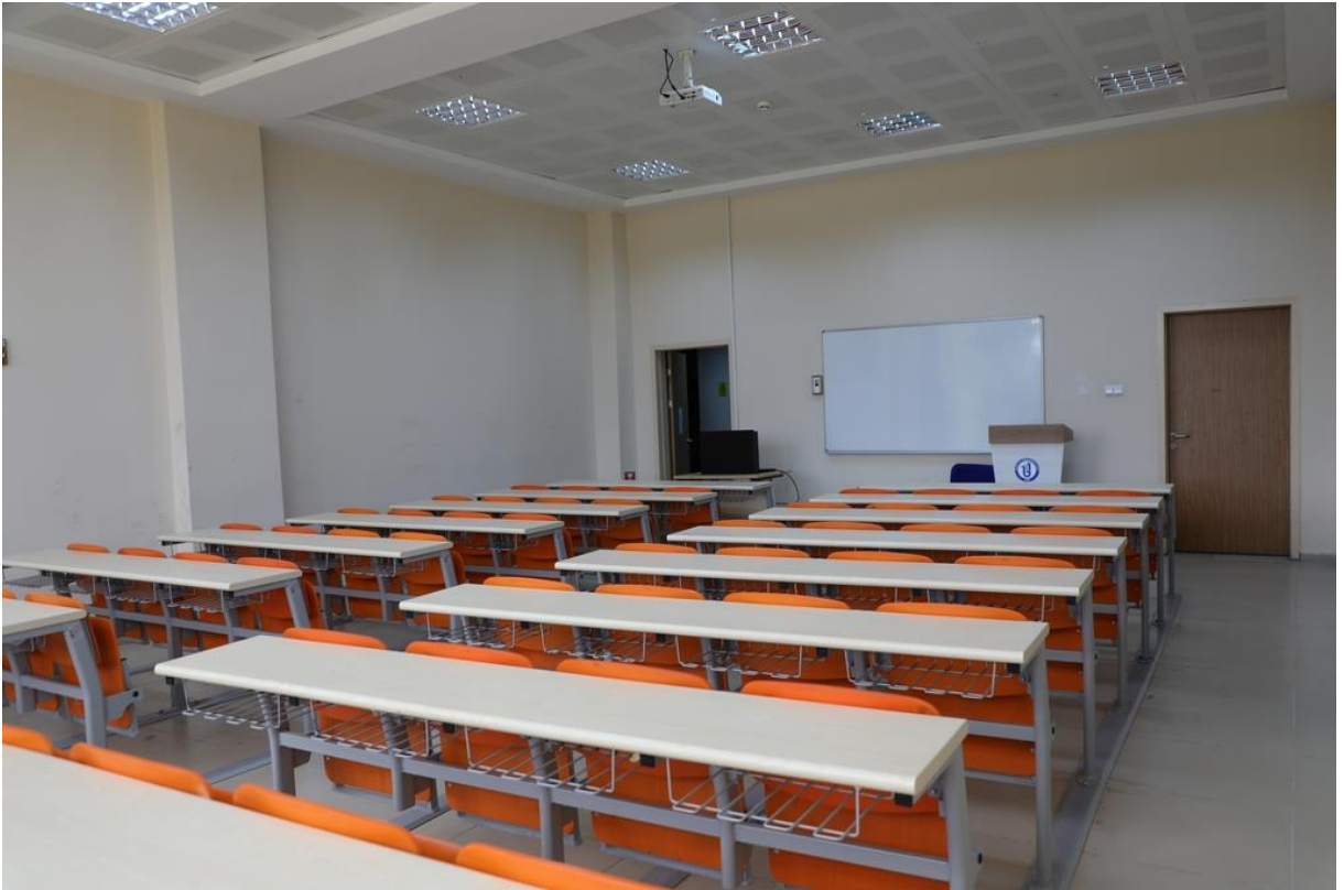
Resim 3 Derslik