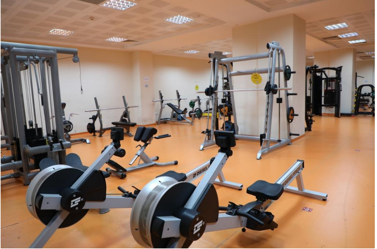
Resim 6 Fitness Salonu