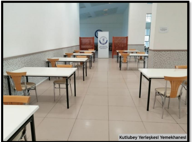
Kutlubey Yerleşkesi Yemekhanesi