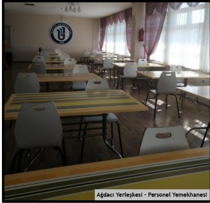
Ağdacı Yerleşkesi - Personel Yemekhanesi