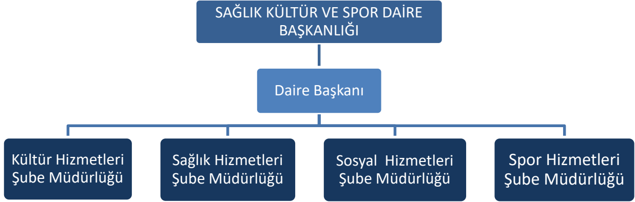
Tablo 1. Sağlık Kültür ve Spor Daire Başkanlığı Teşkilat Şeması