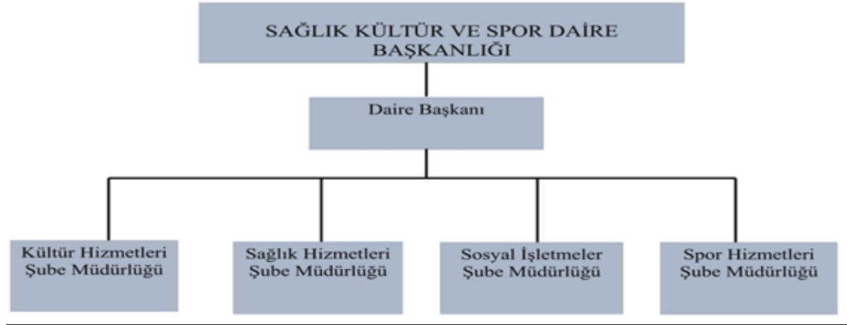
Tablo 1. Sağlık Kültür ve Spor Daire Başkanlığı Teşkilat Şeması