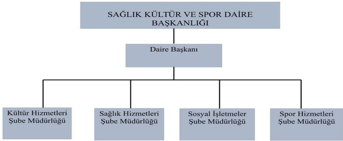
Tablo 1. Sağlık Kültür ve Spor Daire Başkanlığı Teşkilat Şeması