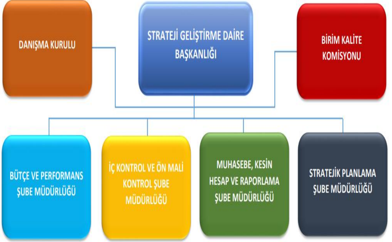
Şekil 4: Birim İdari Teşkilat Şeması