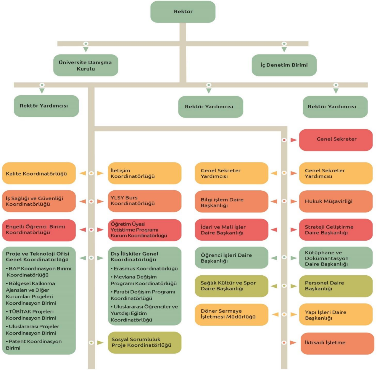
Şekil 4: İdari Teşkilat Şeması