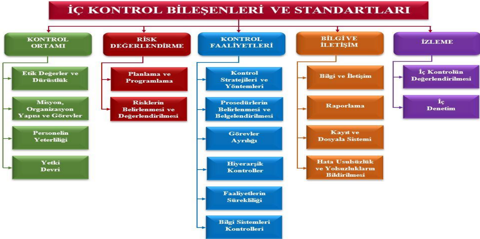
Şekil 1: İç Kontrol Bileşenleri ve Standartları Tablosu

Kamu idareleri mali ve mali olmayan tüm işlemlerinde bu standartlara uymakla ve gereğini yerine getirmekle yükümlü bulunduğu, Kanuna ve İç Kontrol Standartlarına aykırı olmamak koşuluyla idarelerce, görev alanları çerçevesinde her türlü yöntem, süreç ve özellikle işlemlere ilişkin standartlar belirlenebileceği belirtilmiştir.