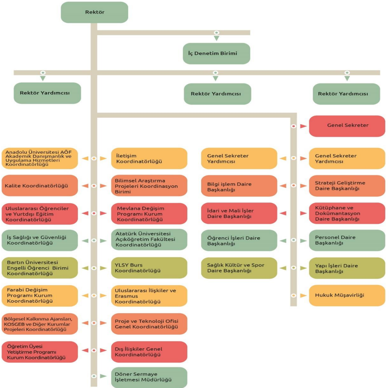
Şekil 2b: İdari Birimler Organizasyon Şeması