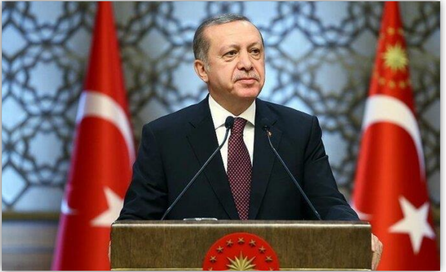
Recep Tayyip ERDOĞAN Cumhurbaşkanı