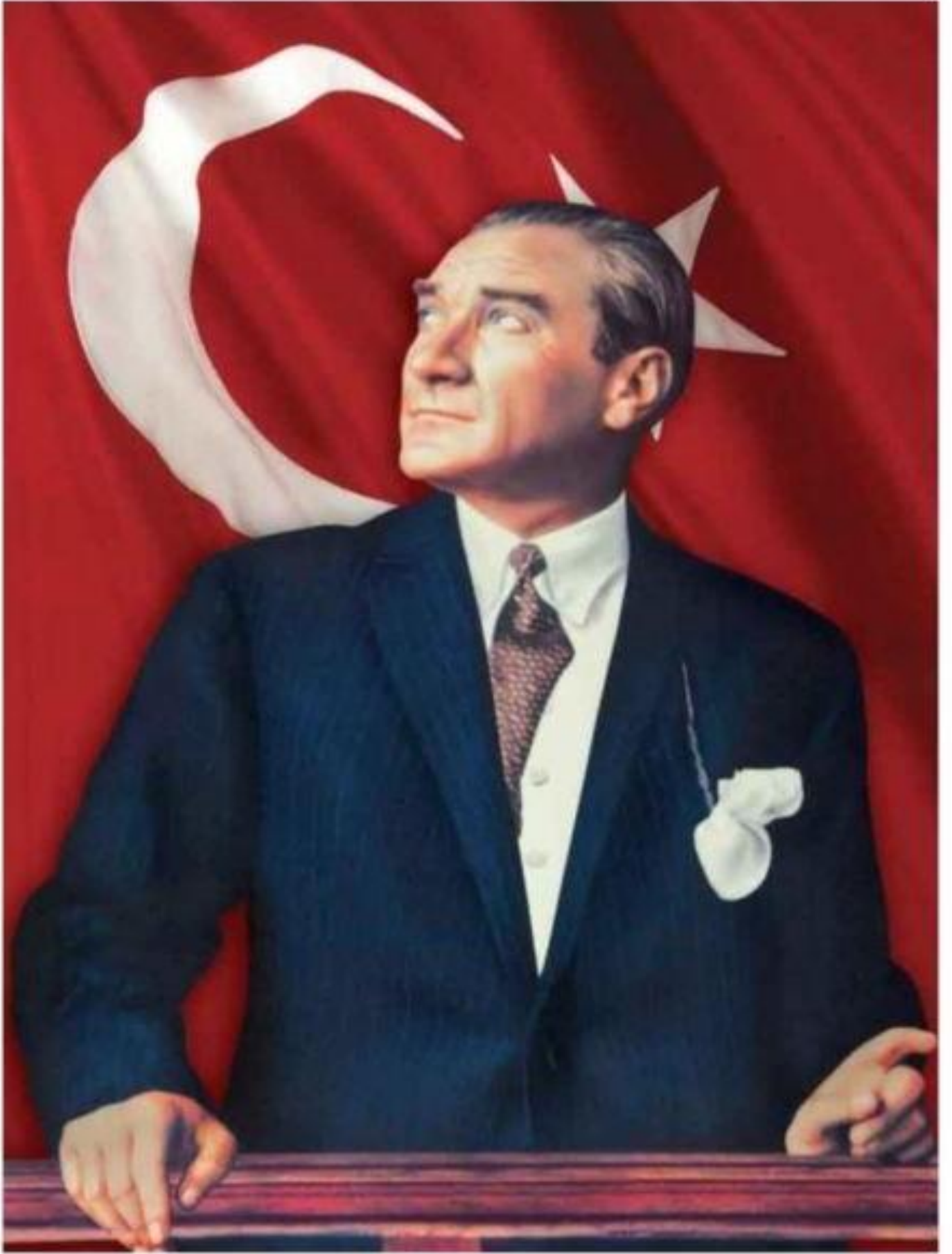
Mustafa Kemal ATATÜRK