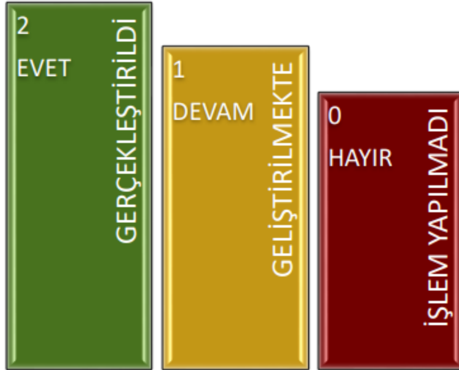
Şekil 3 : İç Kontrol Soru Formu Değerlendirme Ölçütleri

Değerlendirmede birimlerden sorumlu oldukları her bir eylemin gerçekleştirilmiş olması durumunda; Evet (2 puan), çalışmaların devam ediyor olması durumunda; Geliştirilmekte (1 puan) ve herhangi bir işlem yapılmayan durumlarda; Hayır (0 puan) seçeneklerinin işaretlenmesi suretiyle iç kontrol soru formunun cevaplandırılması istenmiştir.