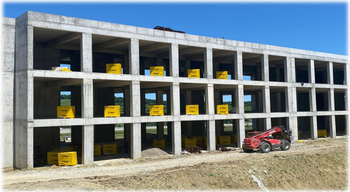
Laboratuvar Binası Yapım İşi

Üniversitemiz yatırım programında yer alan Derslik ve Merkezi Birimler projesi adı altında Yapım ihalesi 27/11/2018 tarihinde yapılmış olup, 32.650.000,00 TL tutarında sözleşme imzalanmış, 31/12/2018 tarihinde iş yeri teslimi yapılmıştır. Ancak 14.06.2023 tarihinde komisyon kararı ile fesih edilmiştir. Fiziksel gerçekleşmesi %21 olarak hesaplanmıştır. İhale hazırlıkları 2024 yılı içerisinde tamamlanmış, 04/03/2025 tarihinde yeni ihalesi yapılmıştır.