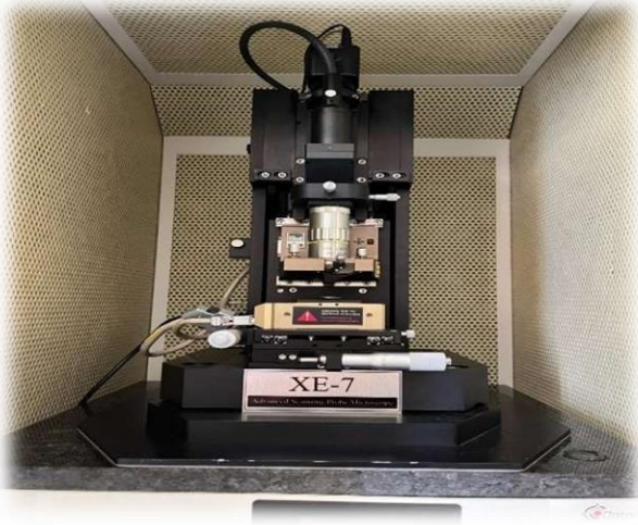
Atomik Kuvvet Mikroskobu

2024 Yılı Yatırım Programında İhtisaslaşma projesinin proje ödeneği 70.000.000,00 TL olarak belirlenmiştir. İhtisaslaşma projesinin başlangıç ödeneği 20.000.000,00 TL olarak tahsis edilmiş olup yıl içerisinde 2024/7 Cumhurbaşkanlığı Tasarruf Tedbirleri Genelgesi kapsamında 2.000.000,00 TL kesilmiştir. Toplam ödenek 18.000.000,00 TL tutarına ulaşmış olup bu ödeneğin tamamı harcanmıştır.