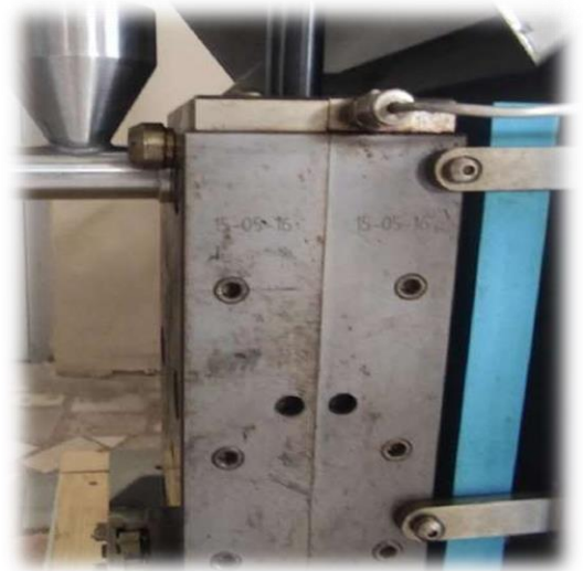
Kompozit Hazırlama Cihazı