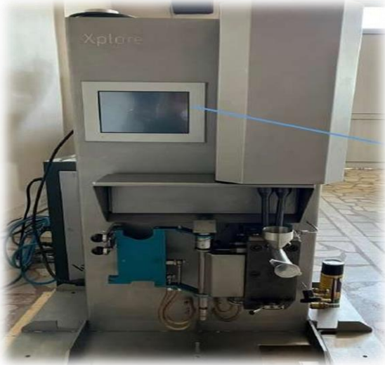
Plastik İşleme Cihazı