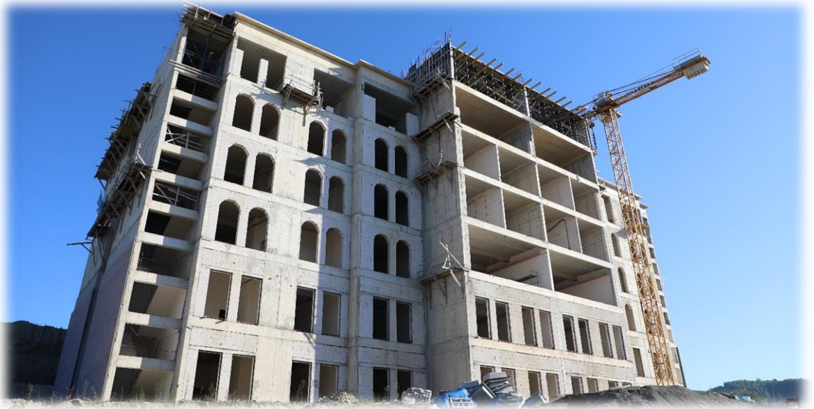
Rektörlük Binası Yapım İşi

2019 yılı ödeneği 4.000.000 ₺ olan altprojeden yıl içerisinde aynı projede bulunan Merkezi Derslik altprojesine 3.374.983 ₺ tutarında ödenek aktarılmıştır. Yapılan aktarım sonrasında 625.017 ₺ tutarında ödenek kalan bu altprojeden 625.016,80 ₺ kadarı 2019 yılı içerisinde olmak üzere toplam 9.780.362,77 ₺ ödeme yapılmıştır.