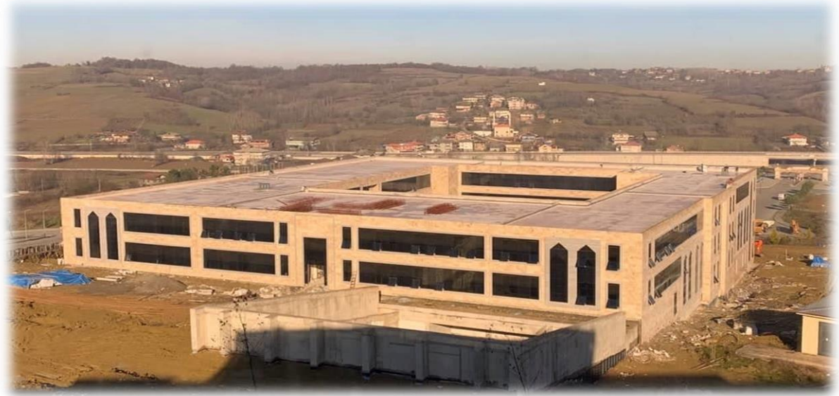
Derslik Binası Yapım İşi

2019 yılı ödeneği 27.144.983 ₺ tutarına ulaşan altproje devam etmekte olup yılsonuna kadar 27.143.597,43 ₺ tutarında ödeme gerçekleştirilmiştir.