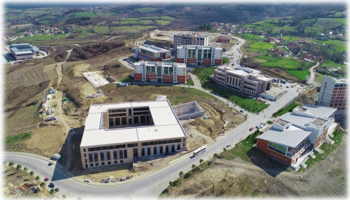
2019 Yılı İtibarı ile Kutlubey Kampüsü Hizmet Binaları Genel Görünüm

Kutlubey Kampüsünde, 2019 Yılı Yatırım Programı ile kampüs altyapısı çalışmalarının yanı sıra Derslik ve Merkezi Birimler Projesi kapsamında Kütüphane Binası, Öğrenci Yaşam Merkezi, Rektörlük Binası, Laboratuvar Binası ve Merkezi Derslik Binası yapım işleri sürdürülmüştür.