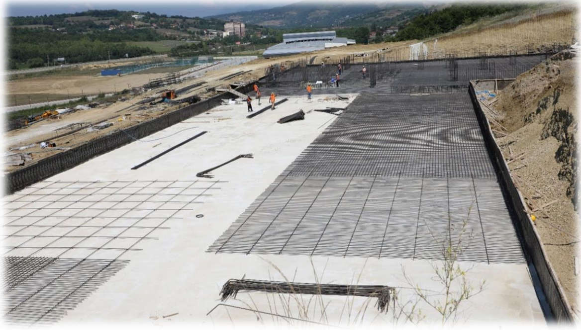
Laboratuvar Binası Yapım İşi