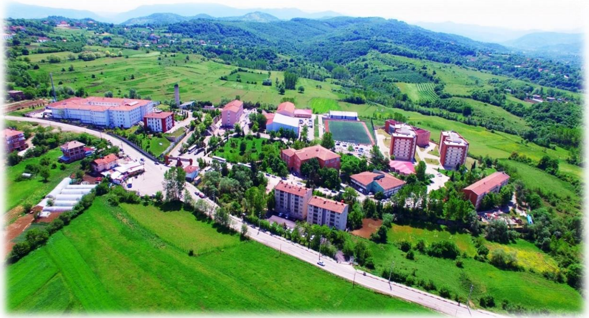
Ađdacı Kamps Genel Grnř

2019 yılsonu itibarı ile 590 akademik personel, 259 idari personel ve 129 srekli iři olmak zere toplam 978 personel ile 17.420 đrenciye hizmet verilmiřtir.