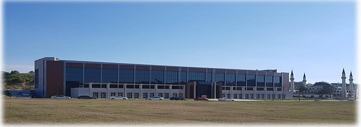
Kütüphane Binası Yapım İşi

Sözleşme bedeli (KDV dahil) 16.189.600 ₺ olup iş artışları ile 17.808.430,70 ₺ tutarına ulaşmıştır. 2019 yılı ödeneği 1.000.000 ₺ olan altprojeden yıl içerisinde 17.975 ₺ olmak üzere toplam 17.039.128,68 ₺ ödeme yapılmıştır. 28.08.2019 tarihinde iş feshedilmiştir. Fiziki gerçekleşmesi %96 olan bu altproje 2020 Yılı Yatırım Programında Muhtelif İşler Projesinde Kesin Hesap altprojesine alınmıştır.