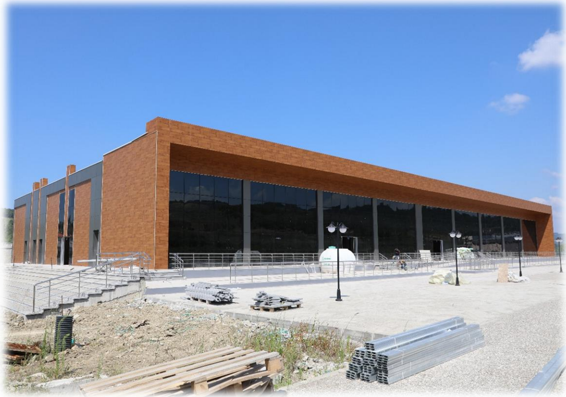
Öğrenci Yaşam Merkezi ve Hafriyat İşi

Fiziki gerçekleşmesi %97 olan bu altproje Öğrenci Yaşam Merkezi ve Hafriyat İşi Geçici Kabul Eksikleri yüklenici nam hesabına yaptırılması işi olarak 2020 Yılı Yatırım Programında Muhtelif İşler Projesinde Kesin Hesap altprojesine alınmıştır.