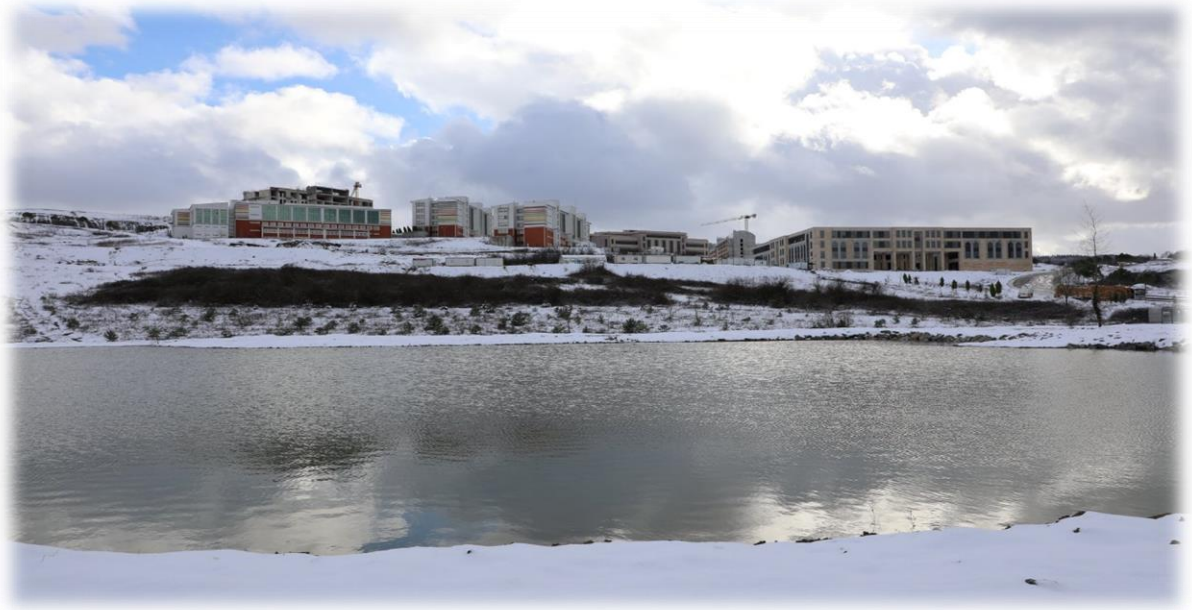
Kutlubey Kampüsü Gölet Alanı

Yapılan aktarmalar sonrasında ödeneği 51.000 ₺ olan projeden Gölet Alanı Kazı ve Tesviye İşleri doğrudan temin ile yapılarak KDV dahil toplam 35.400,00 ₺ ödenmiştir. Projenin harcama oranı %69'tir.