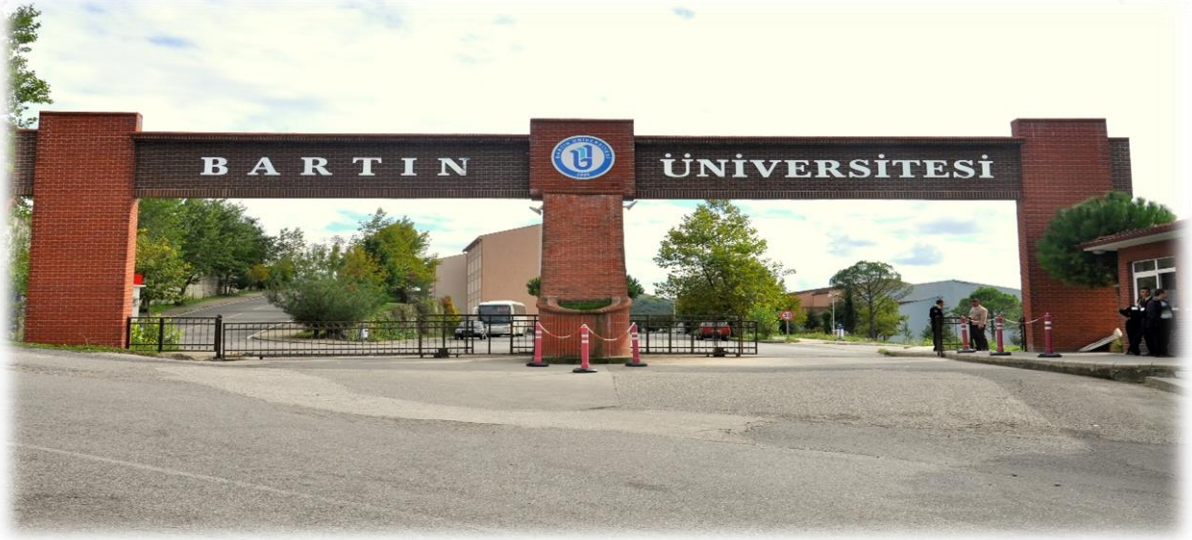
Ağdacı Kampüsü Girişi

5018 sayılı Kamu Mali Yönetimi ve Kontrol Kanununda Merkezi Yönetim Kapsamındaki Kamu İdarelerine ait II Sayılı Özel Bütçeli İdareler Cetvelinde yer alan üniversitemizin yatırım projelerinin 2020 yılı toplam proje bedeli başlangıçta 123.029.000 ₺ tutarındadır.