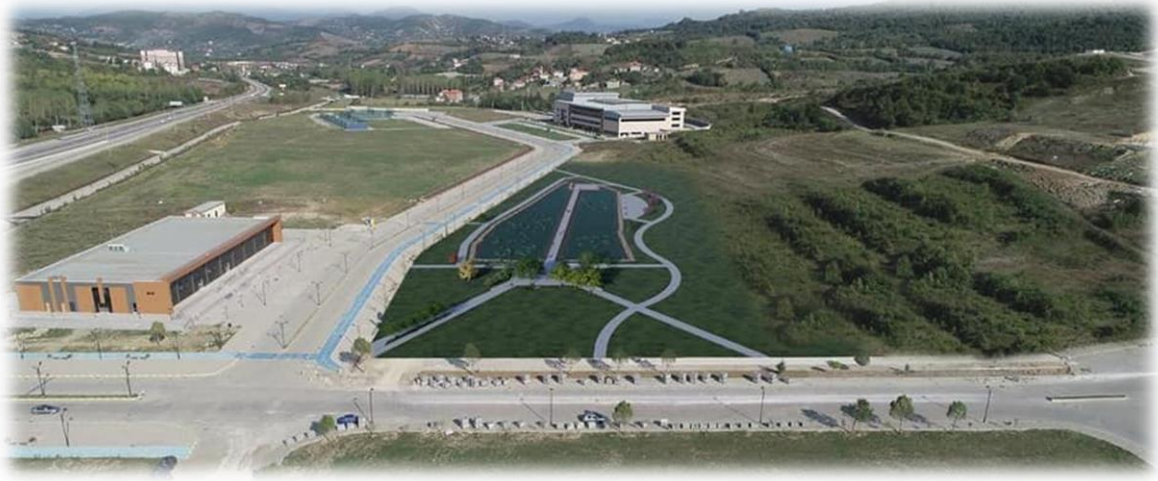
Kutlubey Kampüsü Gölet Alanı

Yapılan aktarmalar sonrasında ödeneği 994.000 ₺ olan projede 17.07.2020 tarihinde KDV dahil 730.420 ₺ bedelle sözleşmesi yapılan Bartın Üniversitesi Kutlubey Kampüsü Gölet ve Çevresi Çevre Düzenleme İşi için mukayese artışı olmuş ve toplam 751.604,90 ₺ ödenmiştir. Projenin harcama oranı %76'dır.