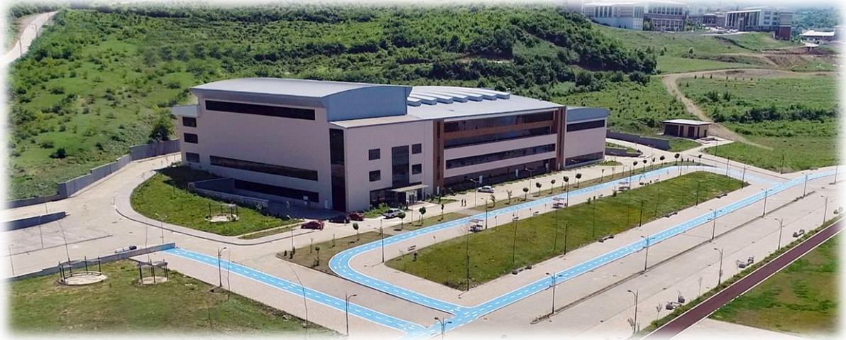
Spor Bilimleri Fakültesi Binası (Bartın Üniversitesi Kutlubey Kampüsü Kapalı Spor Salonu ve BESYO)

Projede mukayese artışı gerçekleşmesi nedeniyle 16.11.2020 tarihli ve 24776198-903.02-202 sayılı Cumhurbaşkanlığı Oluru ile nakde çevrilen teminatlardan 17.132 ₺ tutarında daha gelir fazlası karşılığı ödenek kaydı yapılarak toplam ödeneği 782.952 ₺ tutarına ulaşmış ve tamamı harcanmıştır.