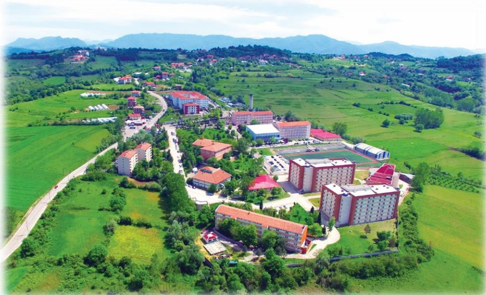
Ağdacı Kampüsü Genel Görünüş

2020 yılsonu itibarı ile 625 akademik personel, 267 idari personel ve 152 sürekli işçi olmak üzere toplam 1.044 personel ile 18.599 öğrenciye hizmet verilmiştir.