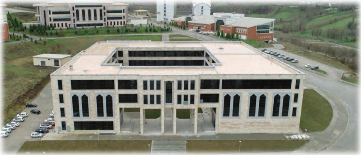
Derslik Binası Yapım İşİ