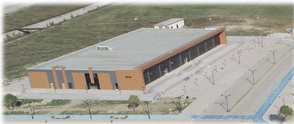
Öğrenci Yaşam Merkezi