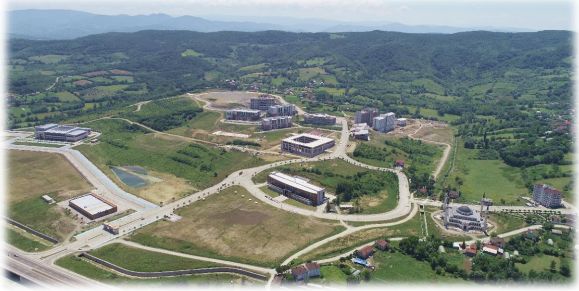
2020 Yılı İtibarı ile Kutlubey Kampüsü Hizmet Binaları Genel Görünüm

2020 yılının ikinci yarısında üniversitemiz Eğitim Fakültesi, İktisadi ve İdari Bilimler Fakültesi ve Lisansüstü Eğitim Enstitüsü Merkezi Derslik Binasında; Bilgi İşlem Daire Başkanlığı ile Kütüphane ve Dokümantasyon Daire Başkanlığı ise Kütüphane Binasında hizmet vermeye başlamıştır.