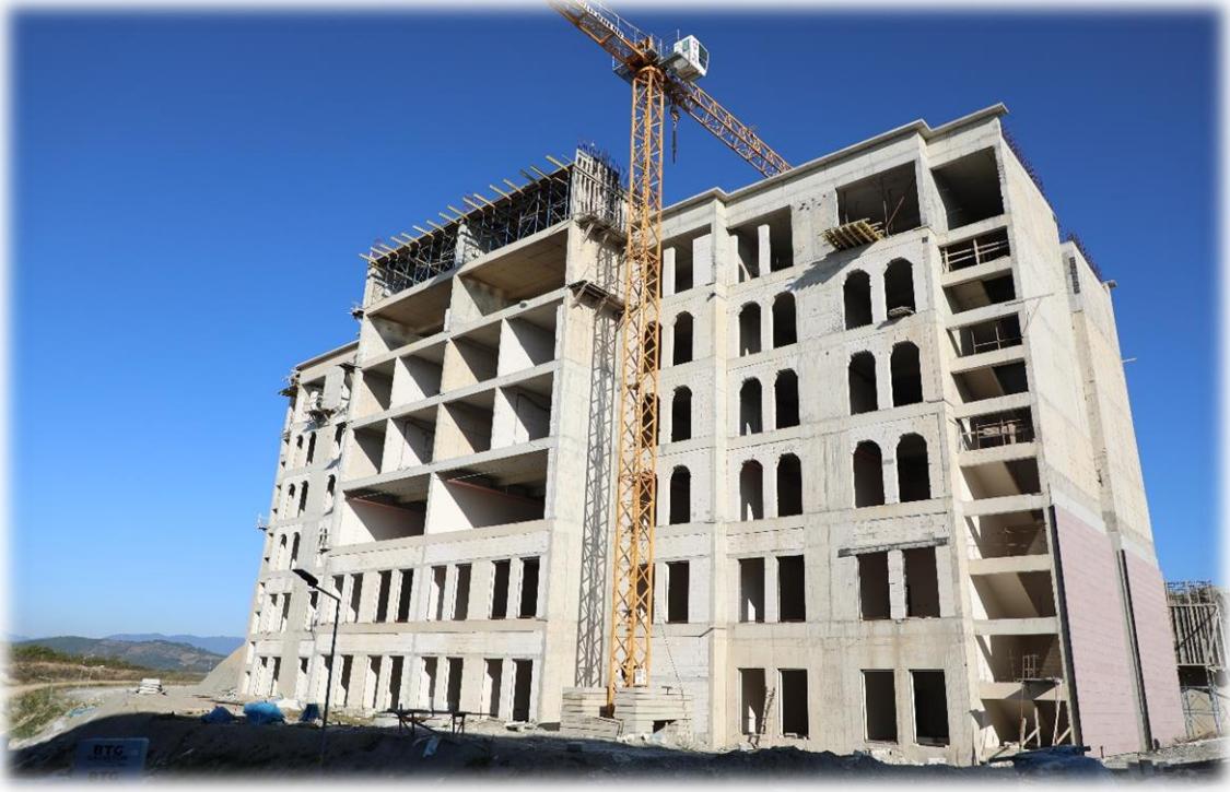
Rektörlük Binası Yapım İşi