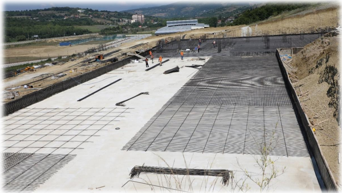
Laboratuvar Binası Yapım İşi

2020 yılı ödeneği 2.000 ₺ olan altprojenin kümülatif harcaması 1.987.839,43 ₺ tutarında olup kümülatif nakdi gerçekleşme oranı % 6 olup fiziki gerçekleşme oranı % 6'dır.