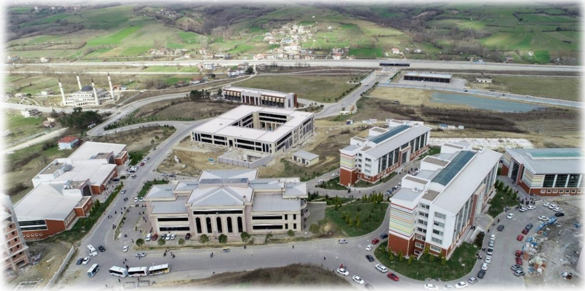
2020 Yılı İtibarı ile Kutlubey Kampüsü Hizmet Binaları Genel Görünüm

Bu çerçevede 2020 Yılı Yatırım Programı ile Derslik ve Merkezi Birimler Projesi ve Engelsiz Yaşam Alanı Projesi ile yapımına devam edilen binalar metrekare olarak Tablo 4'te yer almak olup ayrıca önceki yıllarda yapımları büyük ölçüde tamamlanan Kütüphane Binası, Öğrenci Yaşam Merkezi ve BESYO Binasının ikmal işleri Muhtelif İşler Projesinin Kesin Hesap altprojesinde yürütülmüştür.