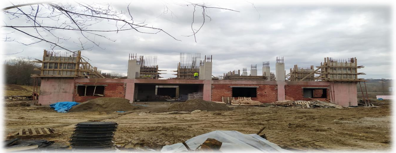
Engelsiz Yaşam Alanı İşi

2020 yılında BAKKA ve üniversitemiz tarafından proje özel hesabına toplam 5.237.255,16 ₺ tutarında aktarım yapılmış olup bu tutardan projede yer alan inşa işlerinin hak edişleri için 2.237.741,85 ₺ tutarında harcama yapılmıştır.