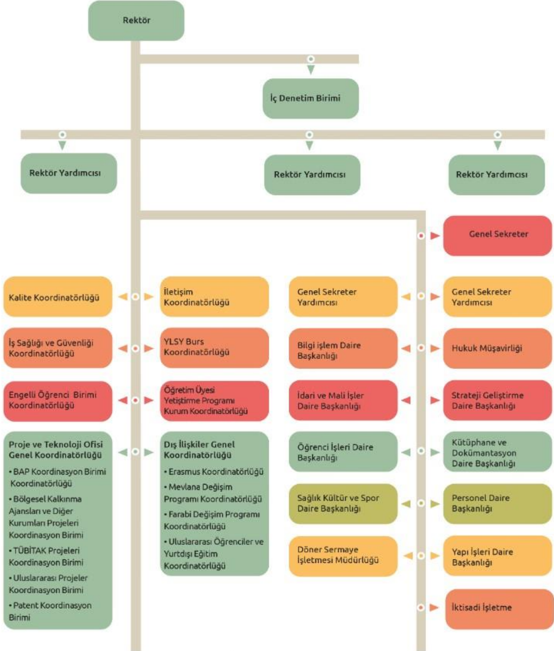
Şekil 2. İdari Teşkilat Şeması