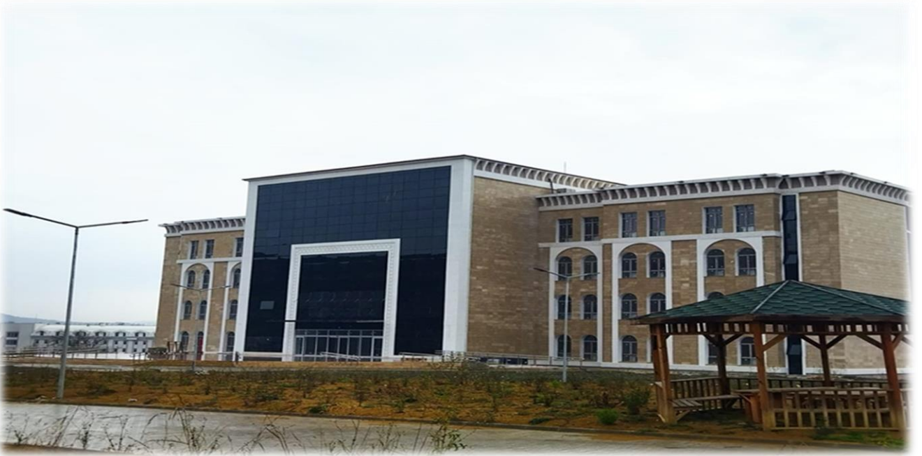
Rektörlük Binası Yapım İşi

Üniversitemiz yatırım programında yer alan Derslik ve Merkezi Birimler projesi adı altında yapım ihalesi 15.02.2021 tarihinde yapılmış olup, 17.582.000,00 TL tutarında sözleşme imzalanmış, 15.03.2021 tarihinde iş yeri teslim yapılarak işe başlanmıştır. 2022 yılında KDV + fiyat farkı dahil 13.057.835,53 TL ödeme gerçekleşmiş olup, fiziksel gerçekleşmesi % 99 olarak hesaplanmıştır.