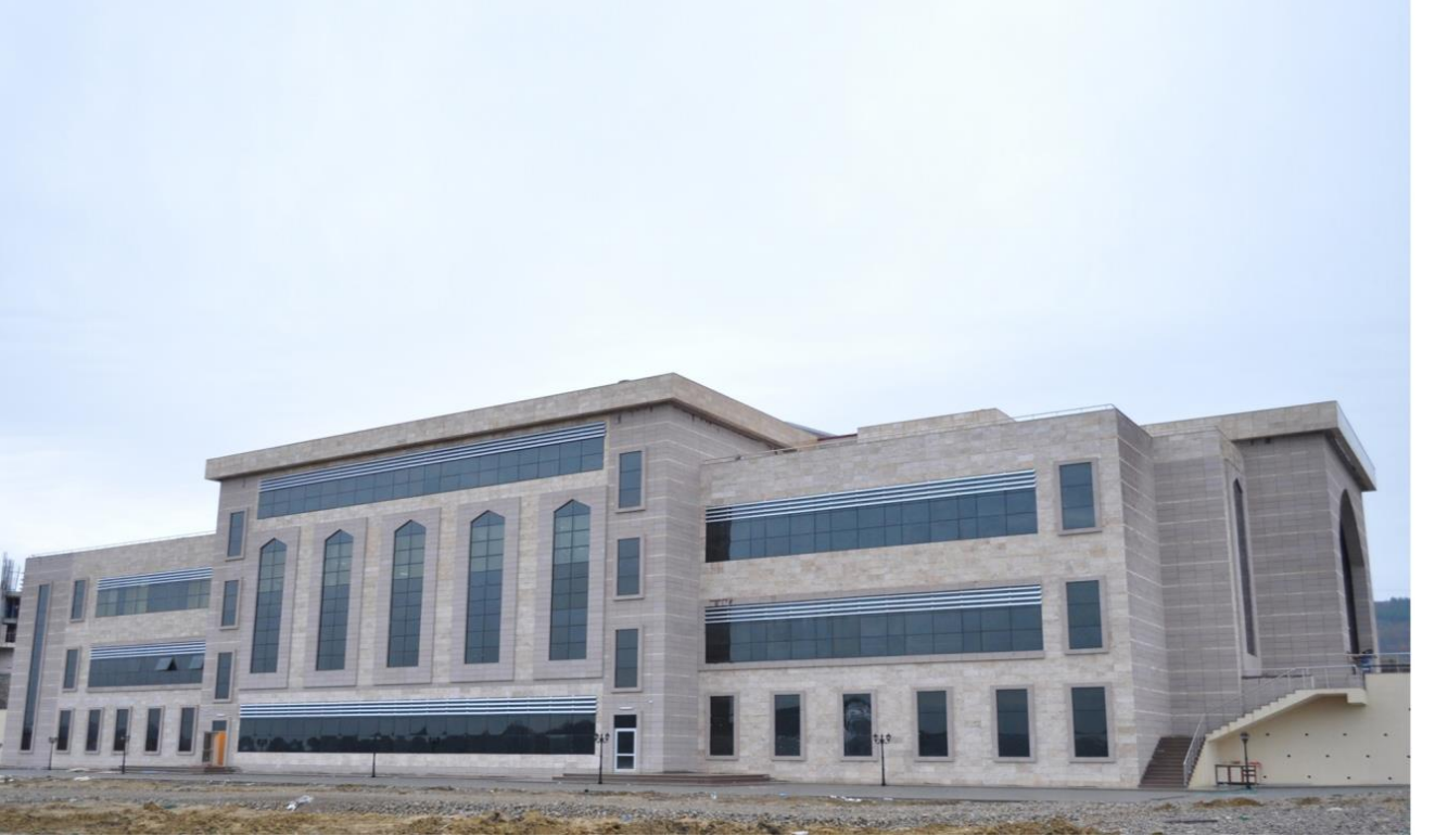
Mimar Sinan Dersliđi (Merkezi Sayısal Derslik)