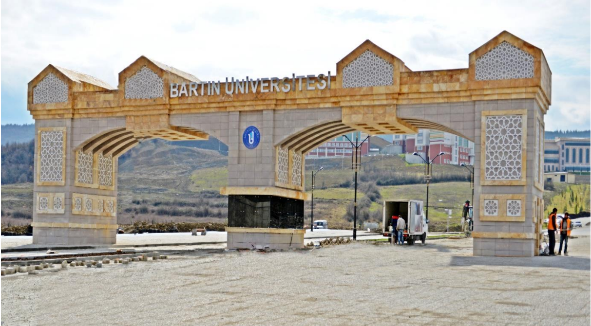
Kutlubey Kampüsü Giriş Kapısı

Bartın Üniversitesi Kutlubey Kampüsü Giriş Kapısı, Yolu ve Peyzajı Yapım İşi için KDV dahil toplam 756.217,23 ₺ ödeme yapılmıştır. 2017 yılı başında teslim alınacaktır.