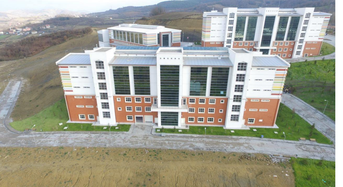
Mühendislik Fakültesi İdari Bina