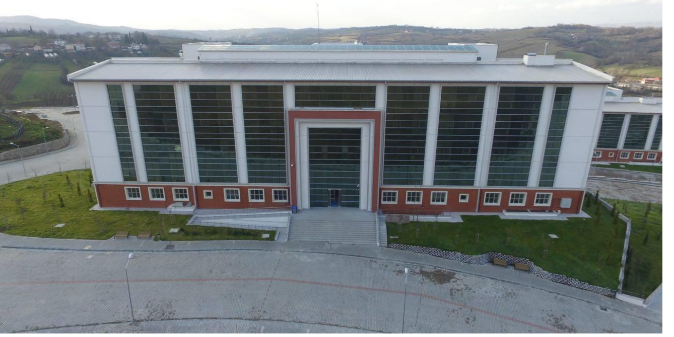
Edebiyat Fakültesi İdari Bina