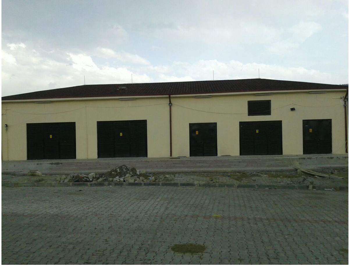
3 No'lu Trafo Binası

3 No'lu Trafo Binası ve Elektrik Hattı Yapım İŖi iin KDV dahil toplam 3.003.887,70 ₺ odenmiŖtir.