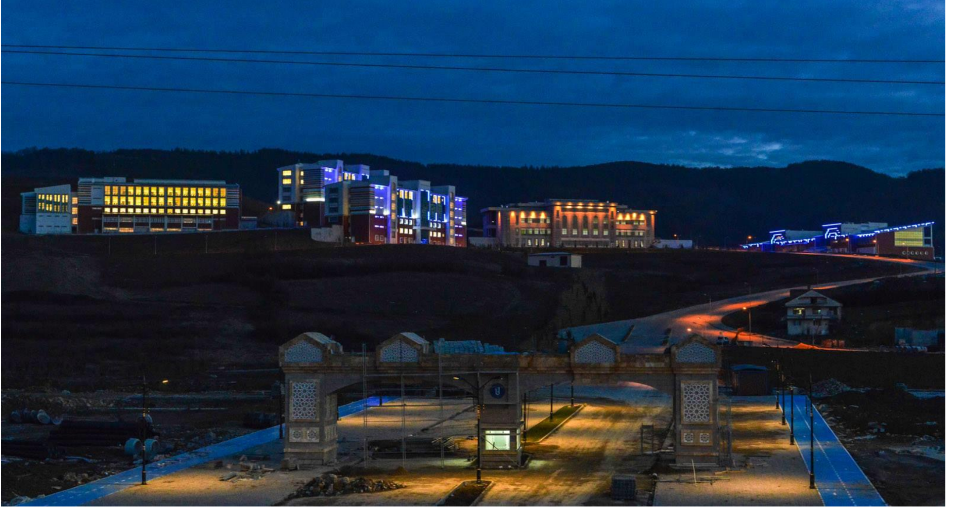
Kutlubey Kampüsü Genel Görünüş