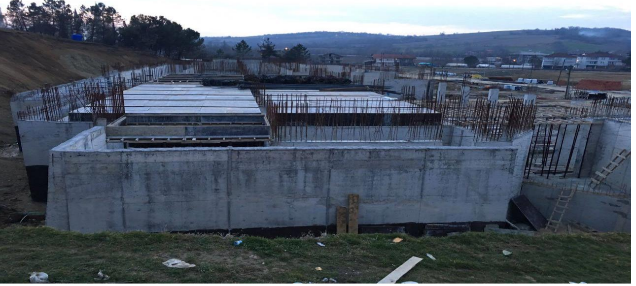
Kütüphane Binası Yapım İşİ

Üniversitemiz Derslik ve Merkezi Birimler Projesi adı altında devam etmekte olan bir diğer iş Kütüphane Binası Yapım İşidir. 22/08/2016 tarihinde yapım sözleşmesi imzalanan işin sözleşme bedeli KDV dahil 16.189.600,00 ₺ olup KDV dahil 1.912.649,40 ₺ ödeme yapılmıştır.