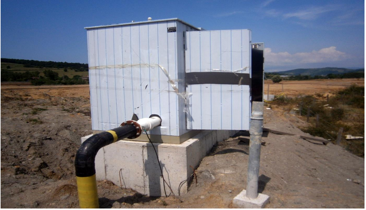
Kutlubey Kampüsü Doğal Gaz Ana Hattı, RMS-B İstasyonu, Gaz Dağıtım Hatları ve Servis Hatlarının Yapım İşi

Bartın Üniversitesi Kutlubey Kampüsü Giriş Kapısı, Yolu ve Peyzajı Yapım İşi için KDV dahil toplam 756.217,23 ₺ ödeme yapılmıştır. 2017 yılı başında teslim alınacaktır.