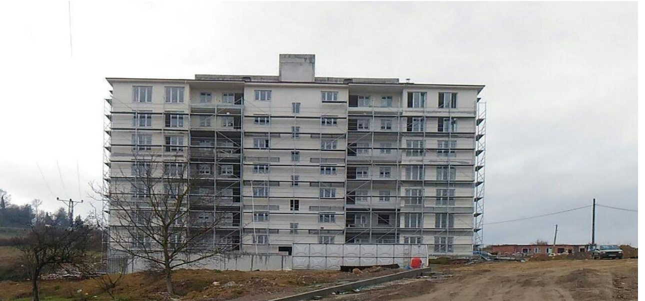
Lojman Binası ve Altyapı Yapım İşİ

Projeye 2016 mali yılı içerisinde 636.000 ₺ tutarında likit karşılığı ödenek eklenmiş, KDV dahil toplam 3.462.235,25 ₺ harcama gerçekleşmiştir. İhtiyaçlar doğrultusunda Derslik ve Merkezi Birimler Projesine 961.184,70 ₺ ve Kampüs Altyapısı Projesine 208.781,39 ₺ tutarında aktarma yapılmıştır.