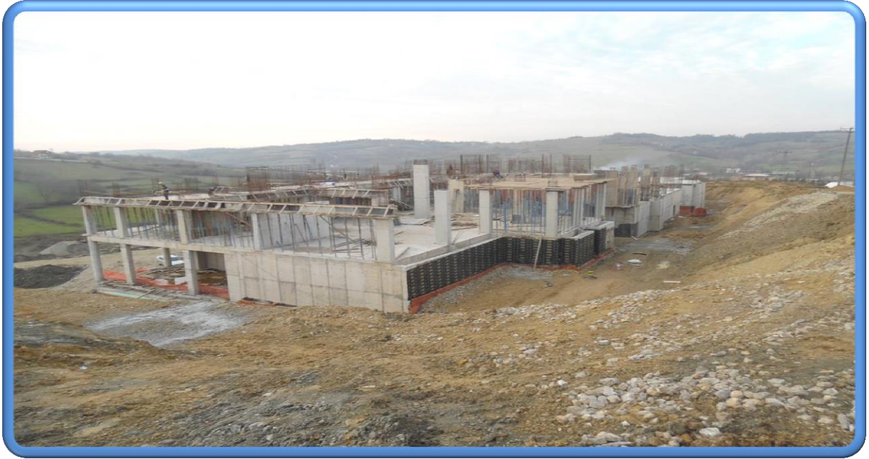
Öğrenci Ve Personel Yemekhane Genel Görünüş

Projenin 2014 yılı başlangıç ödeneği 14.900.000 ₺ olup bu tutara 1.025.000 ₺ ödenek eklenmiştir. Ayrıca 2009 H 030 440 numaralı projeden 1.950.000 ₺, 2009 H 030 460 numaralı projeden 1.500.000 ₺, 2014 H 032 340 numaralı projeden 50.000 ₺ projeler arası aktarım yapılmıştır. Toplam ödeneği 19.425.000 ₺ olan projeden yapılan toplam harcama 17.927.419,81 ₺ tutarındadır.