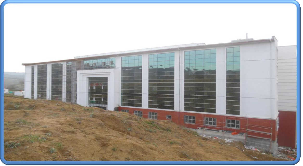
Edebiyat Fakültesi İdari Bina Genel Görünüş