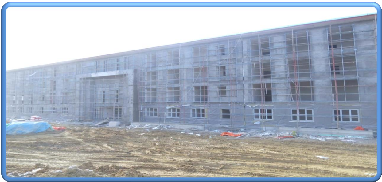
Mühendislik Fakültesi İdari Bina Genel Görünüş