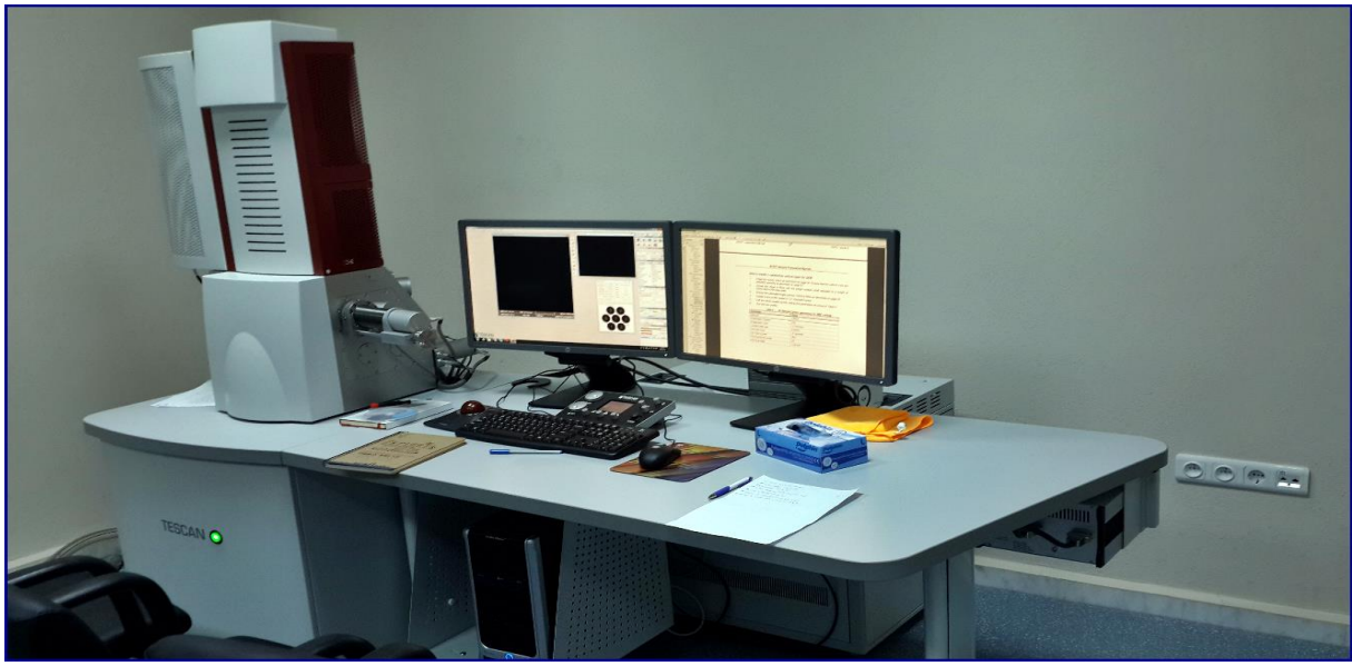
SEM (Scanning Electron Microscopy) Cihazı