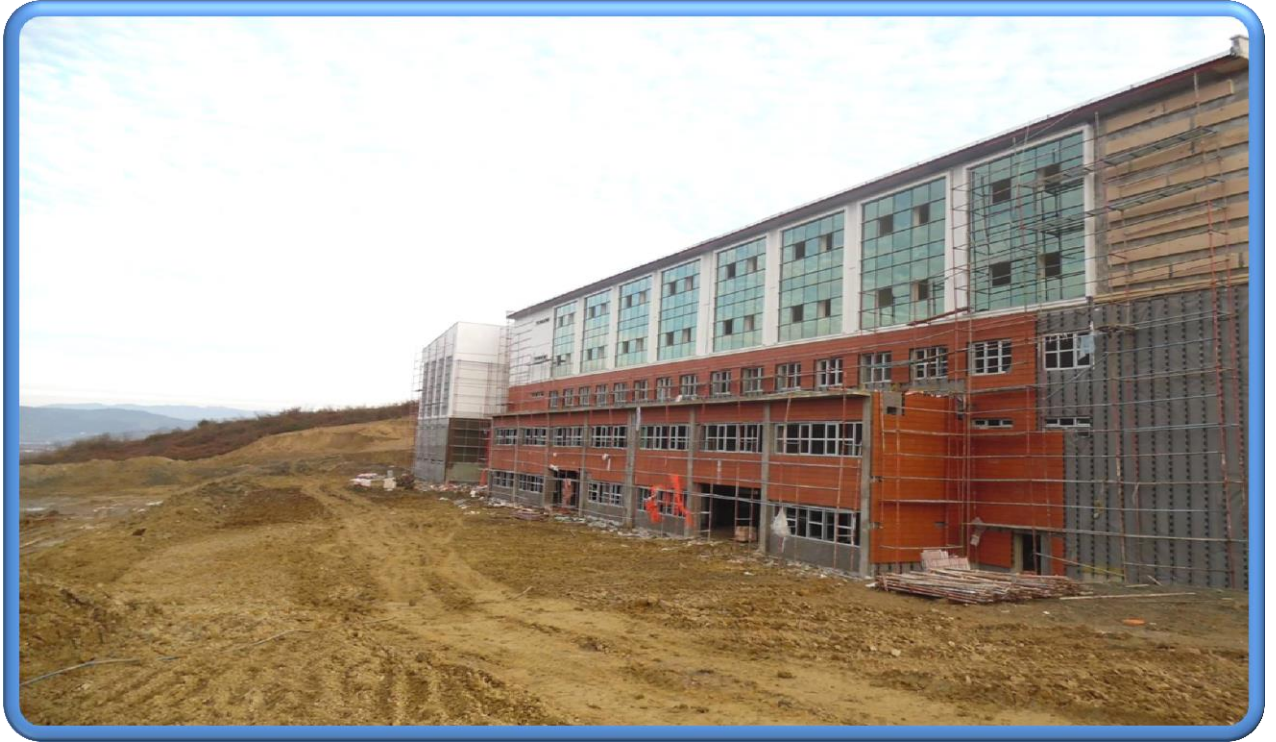
Merkezi Sözel Derslik