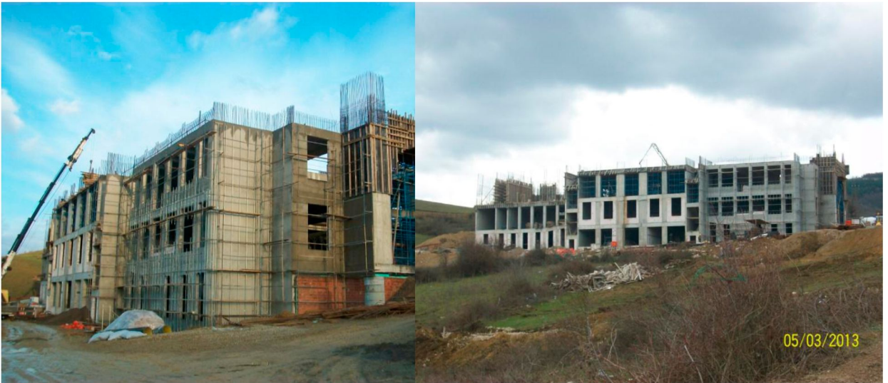
Merkezi Derslik ve Trafo Binaları Yapım İşi