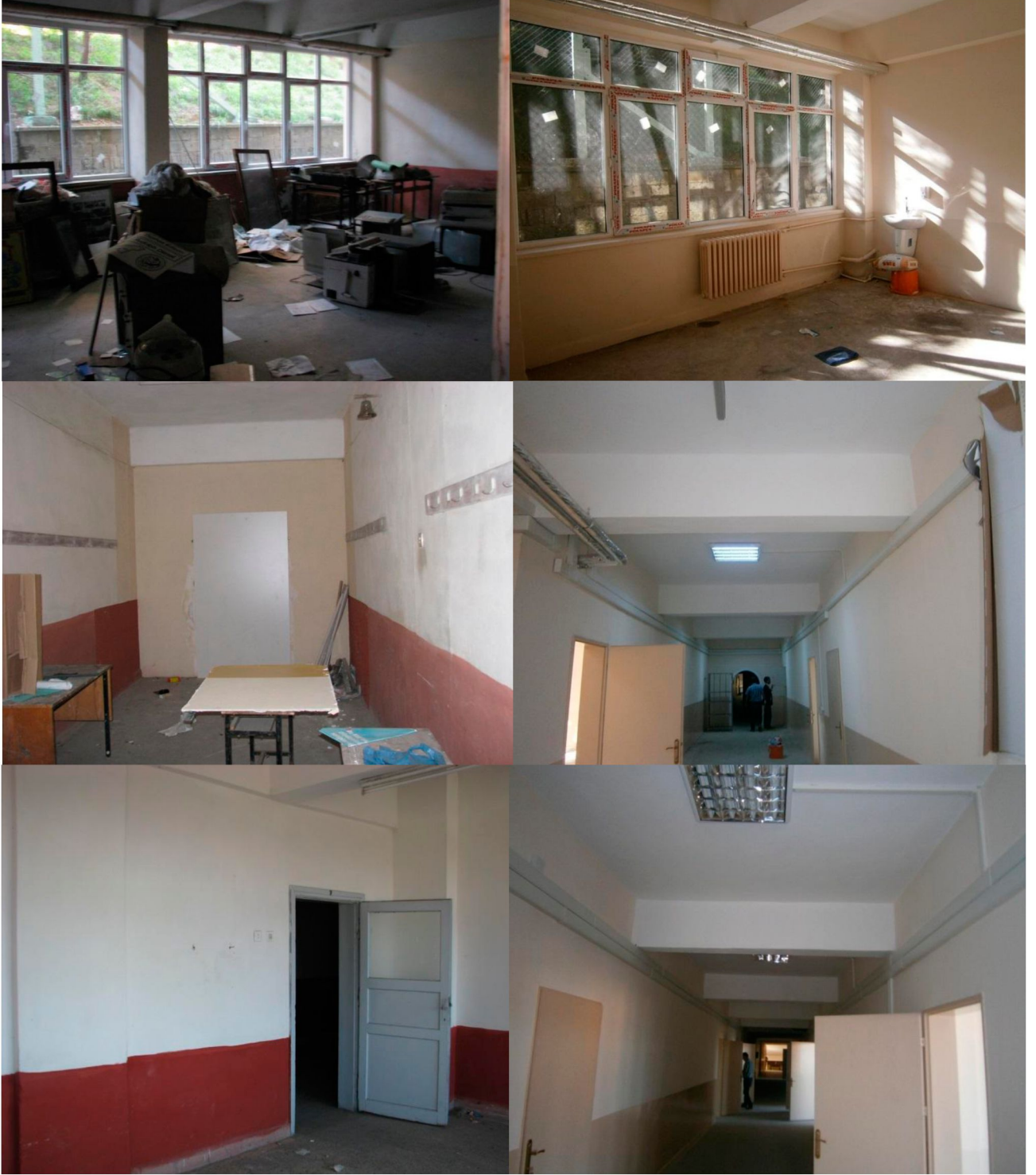
Eğitim Binaları Onarım İşi