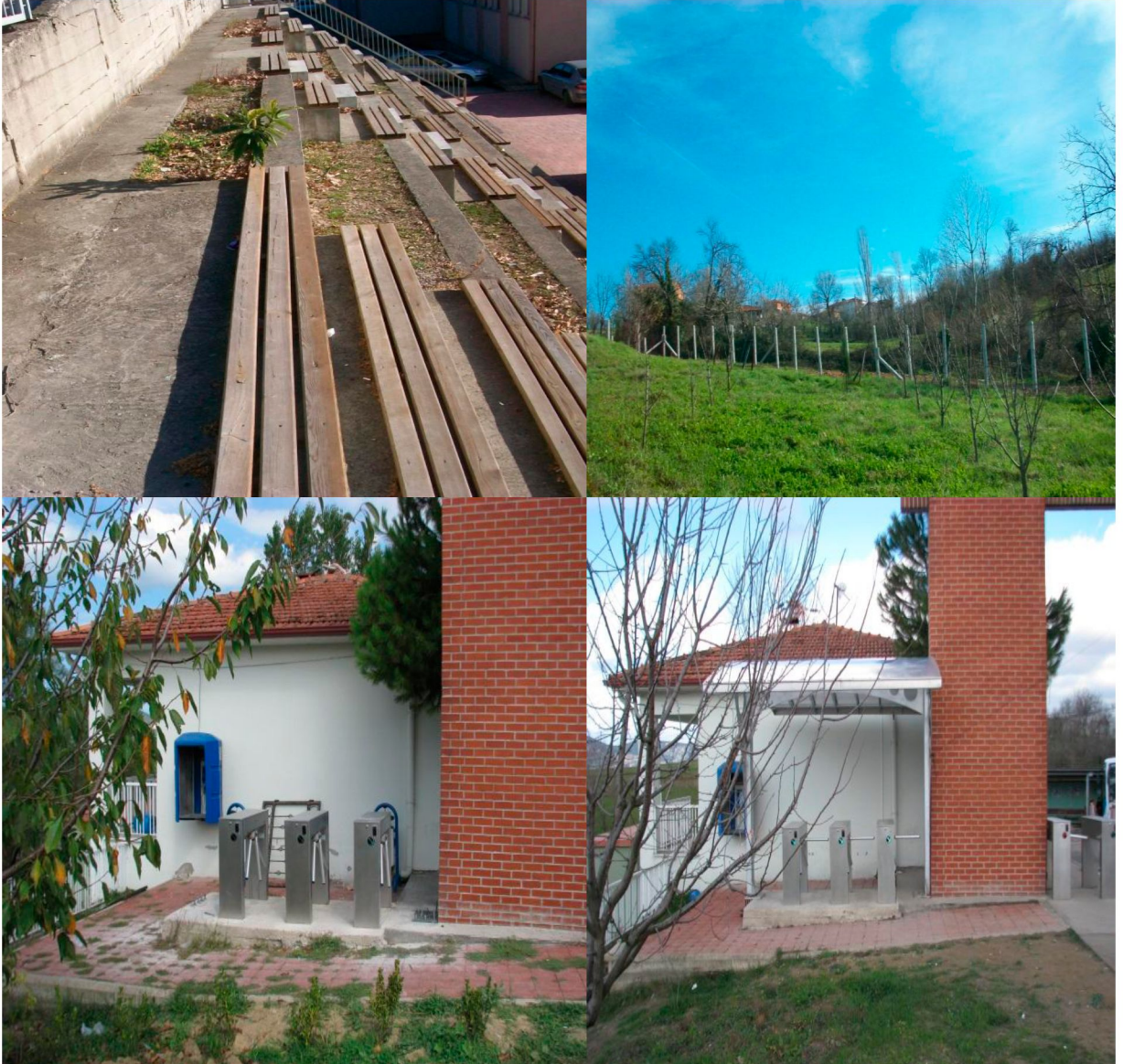
Kampüs İçi Bakım Onarım

Mevcut kampüs alanı içerisinde ve kampüs dışında üniversitemiz Meslek Yüksekokuluna tahsis edilen 3.102 m 2 'lik lise binasında iç ve dış bakım onarımı yapılmıştır. Kampüs çevresinde bulunan ve yıkılarak güvenliği tehlikeye düşüren tel örgüler yenilenmiştir. Kampüs içerisinde ve futbol sahasındaki beton tribünlere emprenye ahşap oturak yapılmıştır. Üniversiteye girişteki turnikeleri yağmurdan ve güneşten korumak amacıyla üzerlerine sundurma yapılmıştır.