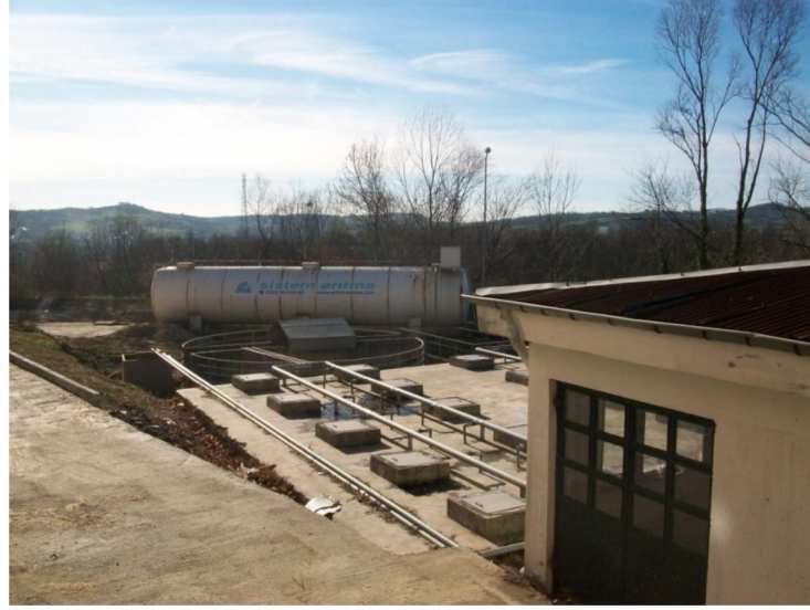
Atık Su Arıtma Tesisat Tadilat İşi

Mevcut Kampüs alanında bulunan arıtma tesisinin işlevini kaybetmesinden dolayı meydana gelen kirliliği gidermek amacıyla Bartın Üniversitesi Betonarme Tip Atık Su Arıtma Tesisat Tadilat İşi 19.04.2012 tarihinde ihaleye çıkılmış olup 27.08.2012 tarihinde tamamlanmıştır.