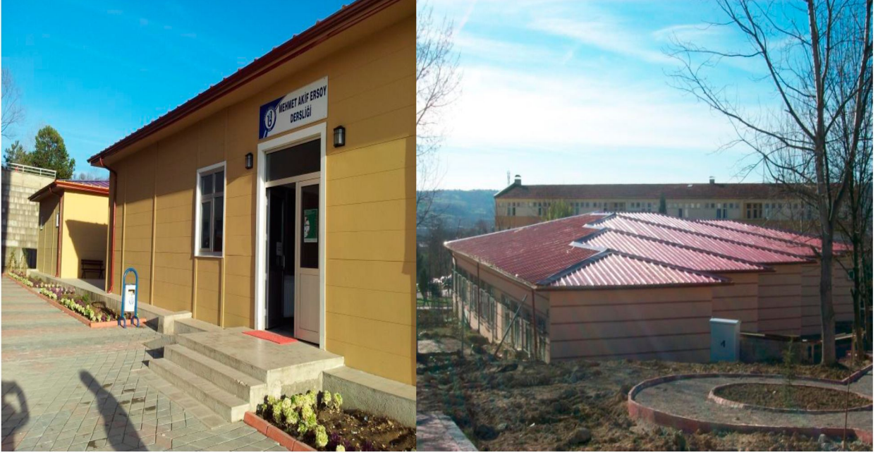
Prefabrik Derslik Binası Yapım İşi

Merkezi Derslik ve Trafo Binaları Yapım İşi elektrik, mekanik, mimari, statik ve jeolojik etüd işi ihale edilmiştir. Merkezi Derslik ve Trafo Binaları Yapım İşi 22.03.2012 tarihinde ihale edilmiş olup iş bitim tarihi 20.08.2013 tür. Merkezi derslik binası 7.652 m 2 , trafo binası 280 m 2 ve 220 m 2 'lik elektrik dağıtım merkezi olmak üzere toplam 8.152 m 2 'lik alandan oluşmaktadır.