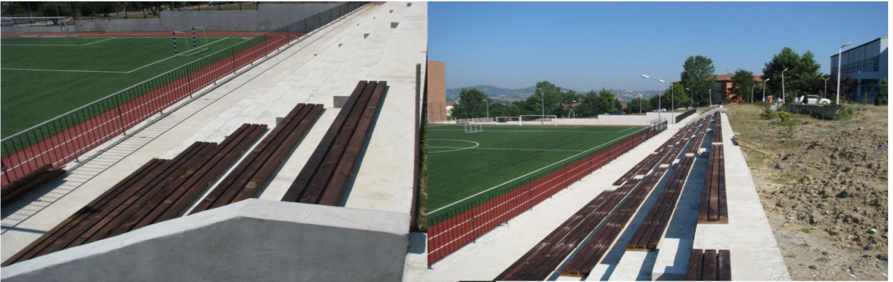
Emprenye Tribün Yapım İşi

Projeden Yapı İşleri ve Teknik Dairesi Başkanlığına 2012 mali yılında 1.200.000 ₺ ödenek tahsis edilmiştir. Projeden, spor salonu soyunma odaları ve fitness statik projelendirme işi ve kampüs emprenye tribün yapım işi için 12.764,53 ₺ harcanmıştır.