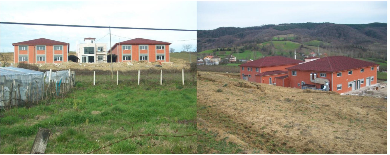
Merkezi Araştırma Laboratuvarının Yapım İşİ

Merkezi Araştırma Laboratuvarının yapım işi 14.04.2011 tarihinde ihale edilmiş olup iş 01.03.2013 tarihi itibarıyla kabulü yapılacaktır. Merkezi araştırma laboratuvarı 271,91 m 2 idari bina, 712,48 m 2 çevre gıda laboratuvarı, 712,48 m 2 ise mekanik laboratuvarı olmak üzere 1.696,87 m 2 'lik alandan oluşmaktadır.