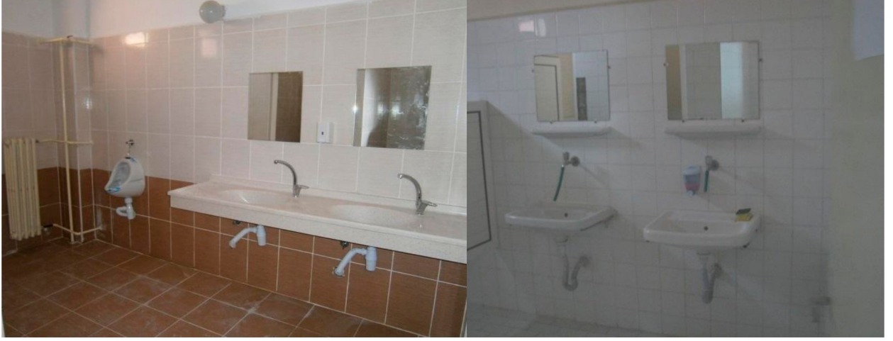
Eğitim Binaları Onarım İşi

Bartın Üniversitesi eğitim binaları ve ısı merkezinde yapılacak olan onarım ve tadilat işi ihalesi kapsamında bay ve bayan olmak üzere on adet tuvalette yer ve duvar seramikleri sökülerek yerine yeni yer ve duvar seramiği yapılmıştır. Seramik haricinde kalan duvar ve tavan plastik boya ile boyanmıştır.