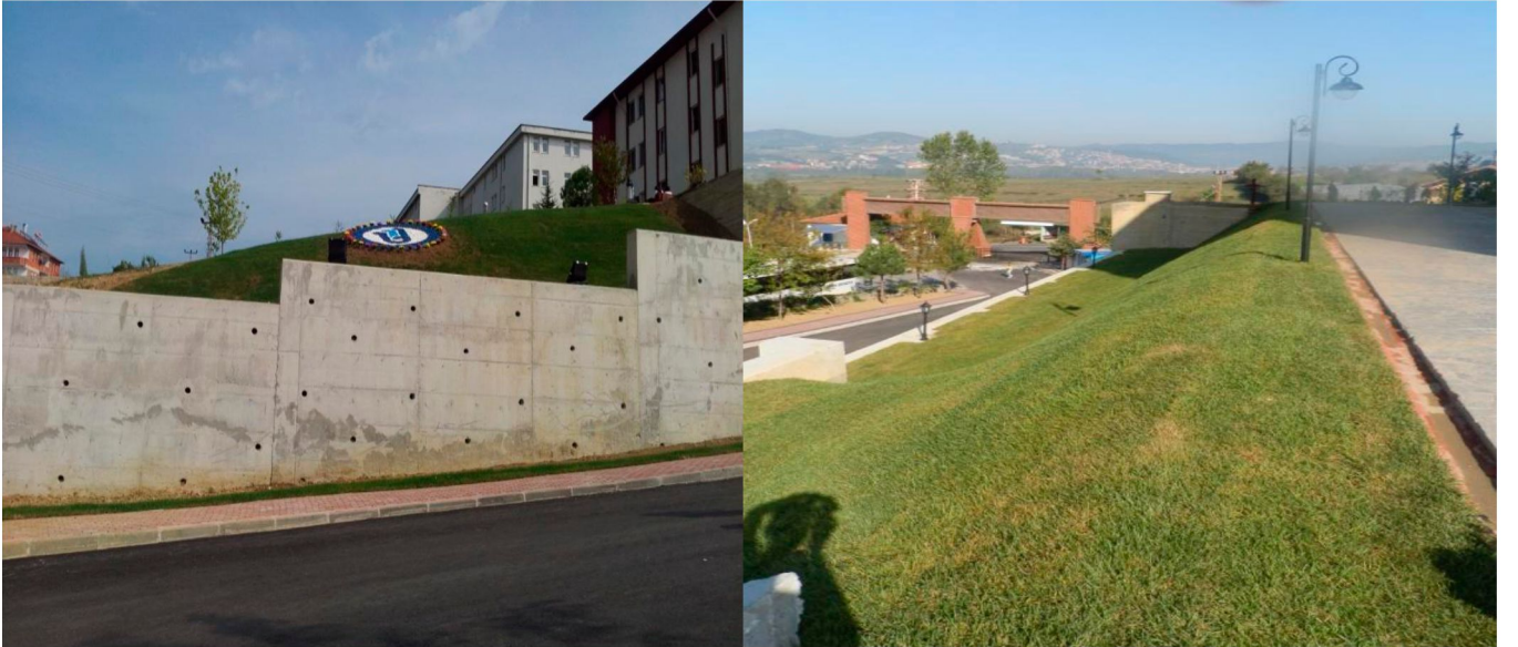
Rektörlük Önü Peyzaj Çalışması ve Aydınlatma İşi