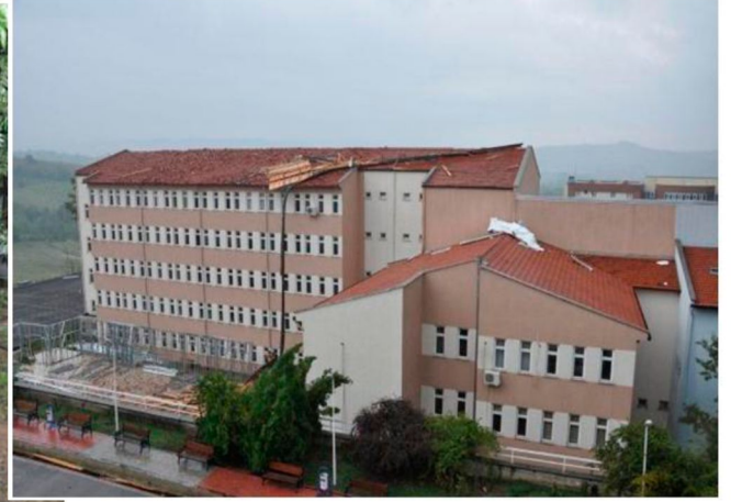
Fırtına Sonucu Oluşan Hasar