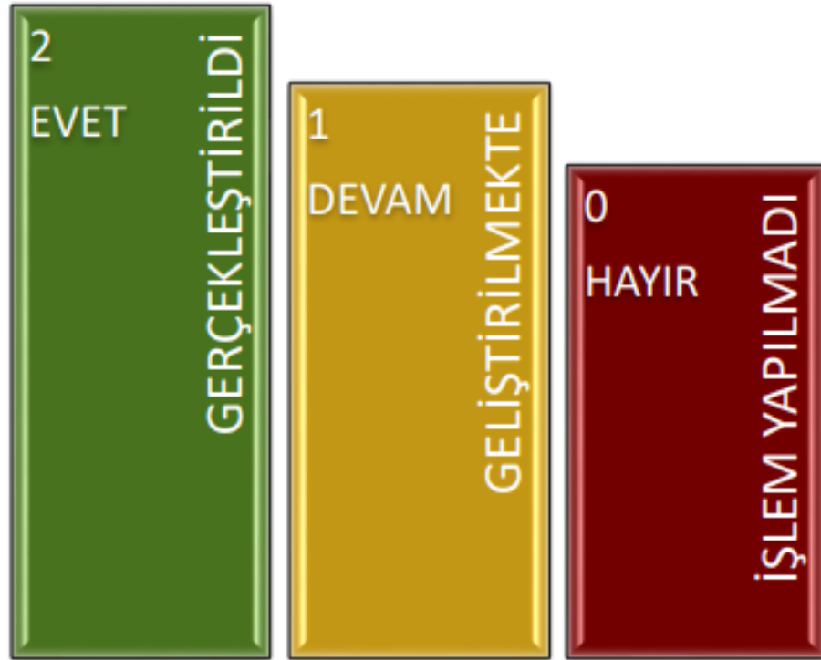
Şekil 3 : İç Kontrol Soru Formu Değerlendirme Ölçütleri

Değerlendirmede birimlerden sorumlu oldukları her bir eylemin gerçekleştirilmiş olması durumunda; Evet (2 puan), çalışmaların devam ediyor olması durumunda; Geliştirilmekte (1 puan) ve herhangi bir işlem yapılmayan durumlarda; Hayır (0 puan) seçeneklerinin işaretlenmesi suretiyle iç kontrol soru formunun cevaplandırılması istenmiştir.