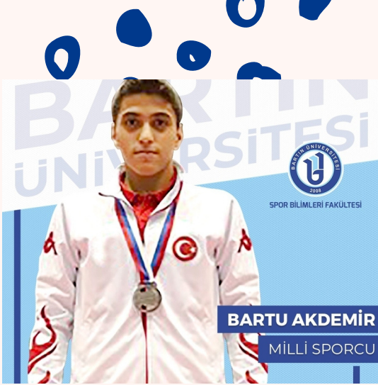
2021 İşitme Engelliler Dünya Güreş Şampiyonası Bartın Üniversitesi Spor Bilimleri Fakültesi Öğrencisi