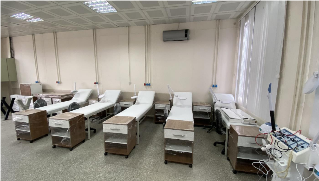
Şekil 4. Uygulama Atölyesi

Üniversitemiz Ağdacı Kampüsü, Bartın şehir merkezine 5 km uzaklıkta Ağdacı mahallesinde Hazine'ye ait 87.520,00 m 2 'lik alan üzerinde kurulmuştur. Bartın Üniversitesi Sağlık Hizmetleri Meslek Yüksekokulu Eylül 2017'de Ağdacı kampüsüne taşınmıştır. Ağdacı kampüsünde bulunan BÜ Saç Bakımı ve Güzellik Hizmetleri Bölümünün 1 adet Saç Bakımı ve Yapımı, 1 adet Güzellik Hizmetleri olmak üzere 2 adet Uygulama Atölyesi bulunmaktadır.