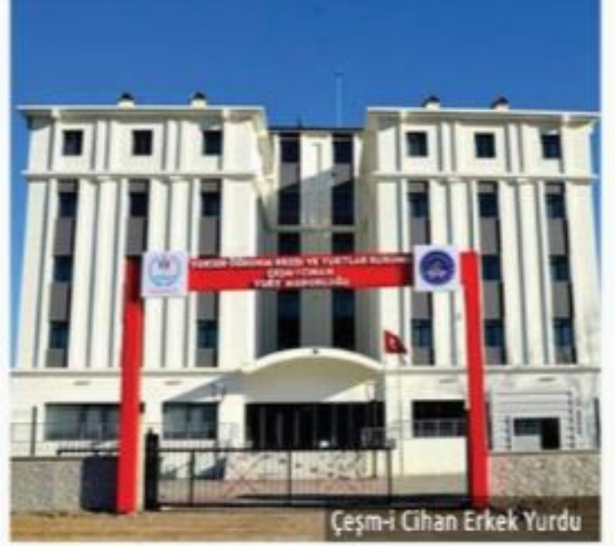
Çeşm-i Cihan Erkek Yurdu

Bartın Çeşm-i Cihan yurdu şehir terminaline çok yakın bir mesafededir. Kutlubey Kampüsü'ne araçla 10 dakika uzaklıkta olan 664 kişilik yurt, şehir merkezine ise 20 dakika mesafededir.