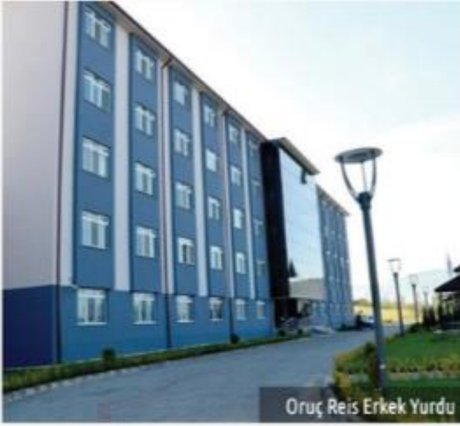
Oruç Reis Erkek Yurdu