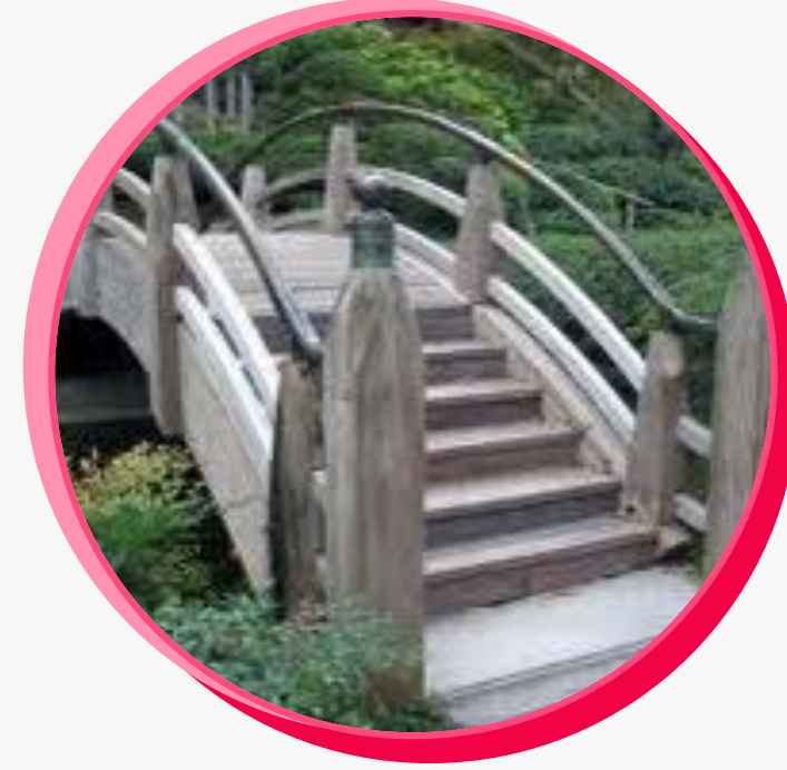
Ahşap tasarım ve yapı