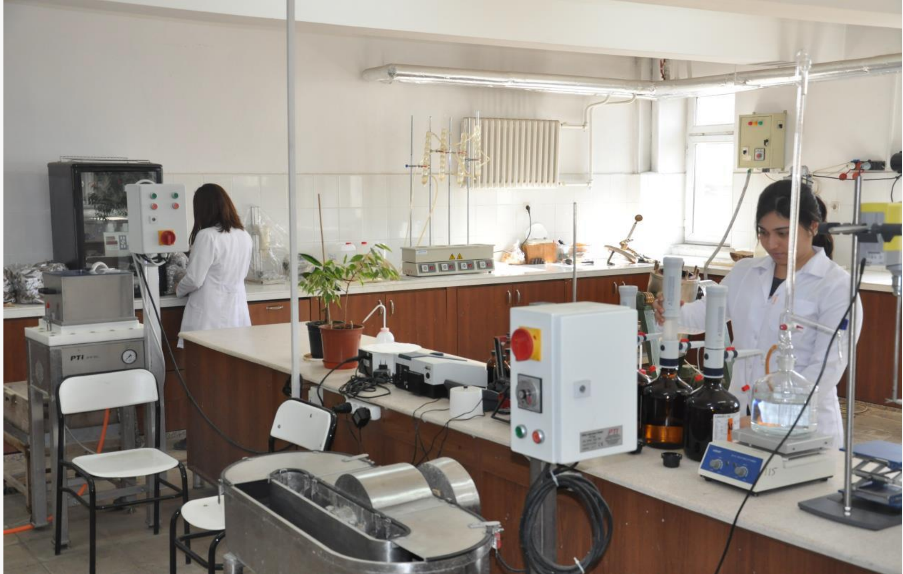
Orman Endüstri Mühendisliği Bölümü