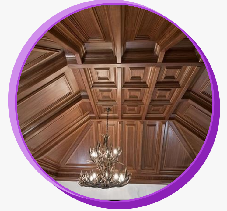
İç mekan tasarım

Ahşap esaslı levhalar: Ahşabı yongalayarak veya liflere ayırarak ve yapıştırıcı maddeler kullanarak ya da kullanmadan presleme, buharlama, kurutma ve emprenye etme gibi işlemlerle yapısını değiştirmeden veya fiziksel ve kimyasal yollarla değiştirerek işlemek.