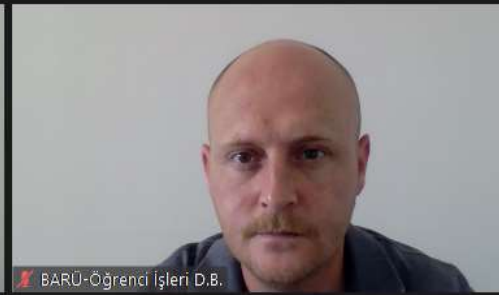
BARÜ-Öğrenci İşleri D.B.