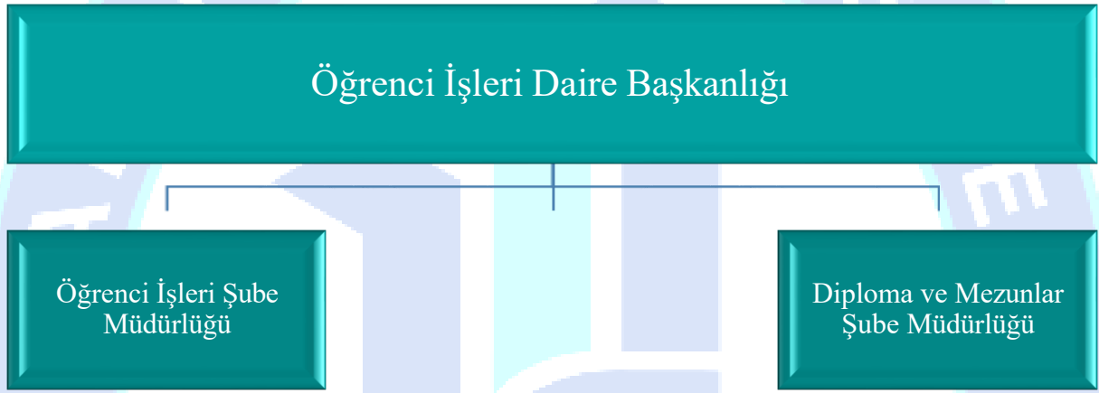
Tablo 2: Öğrenci İşleri Daire Başkanlığı Teşkilat Şeması

Başkanlığımız bünyesinde Öğrenci İşleri Şube Müdürlüğü ile Diploma ve Mezunlar Şube Müdürlüğü bulunmaktadır. Birim teşkilat şeması Tablo 2'de sunulmuştur.