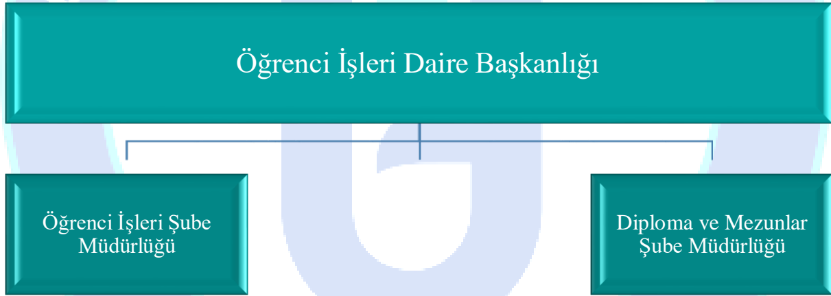
Tablo 2: Öğrenci İşleri Daire Başkanlığı Teşkilat Şeması

Başkanlığımız bünyesinde Öğrenci İşleri Şube Müdürlüğü ile Diploma ve Mezunlar Şube Müdürlüğü bulunmaktadır. Birim teşkilat şeması Tablo 2'de sunulmuştur.