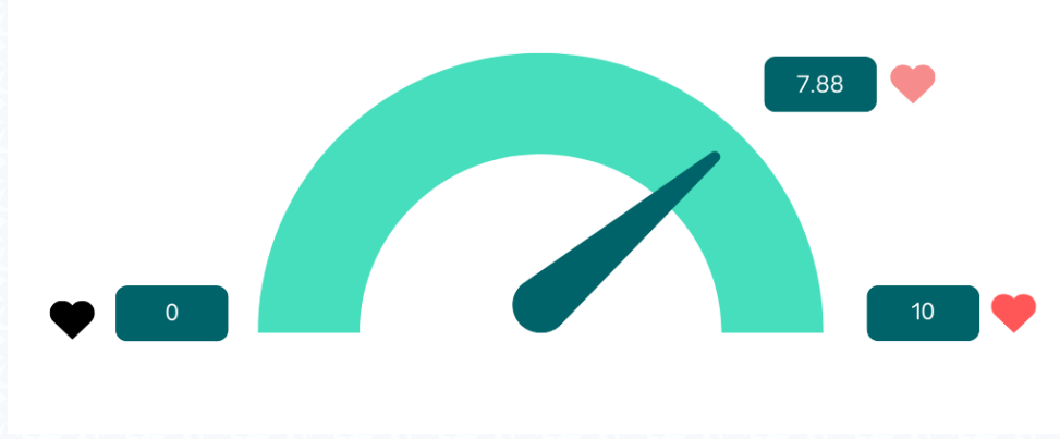
Şekil 3. Akademik personelin eğitimlerden genel memnuniyet durumu