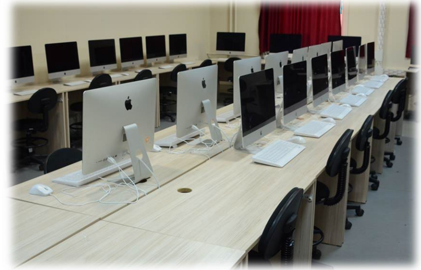
Bilgisayarlı Tasarım Atölyesi