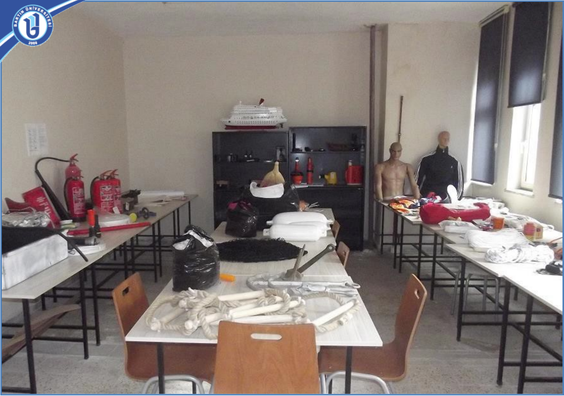
Denizcilik Eğitim Laboratuvarı