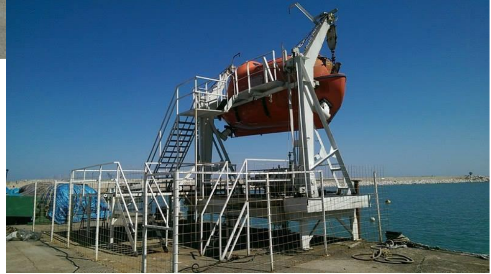
Denizde kişisel canlı kalabilme eğitimleri atlama platformu (Can Salı – Can Filikası)