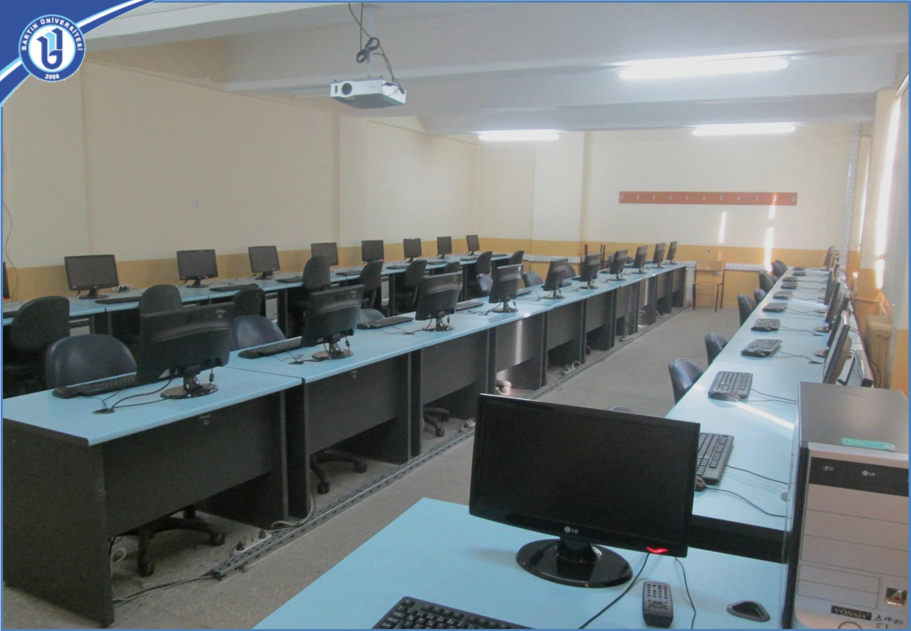
Bilgisayar Laboratuvarı I