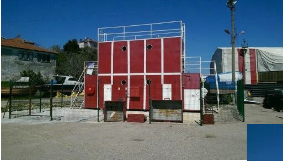
Yangın Eğitim Platformu