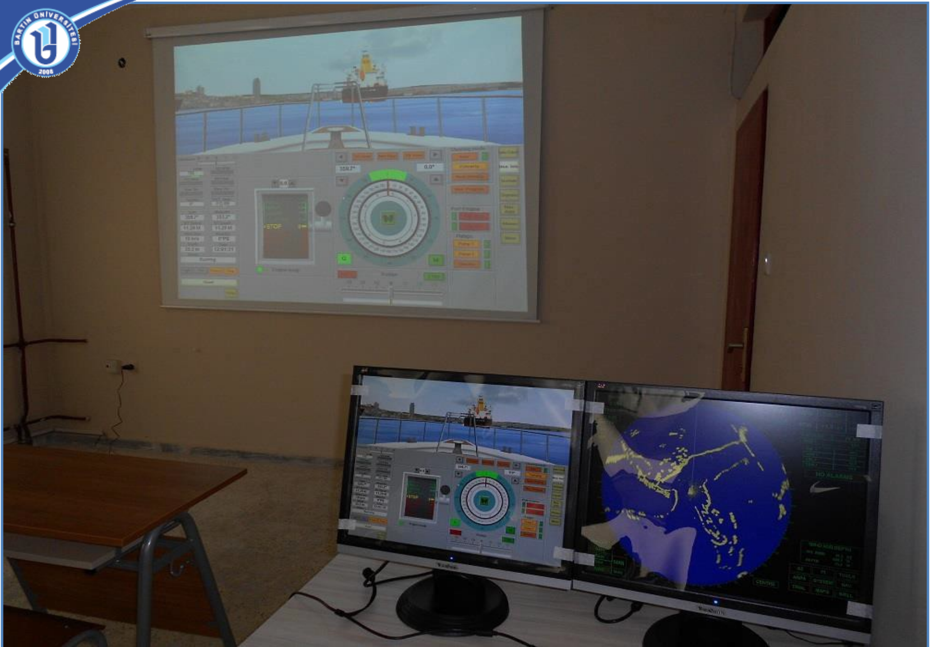
Arpa Radar Simülatörü