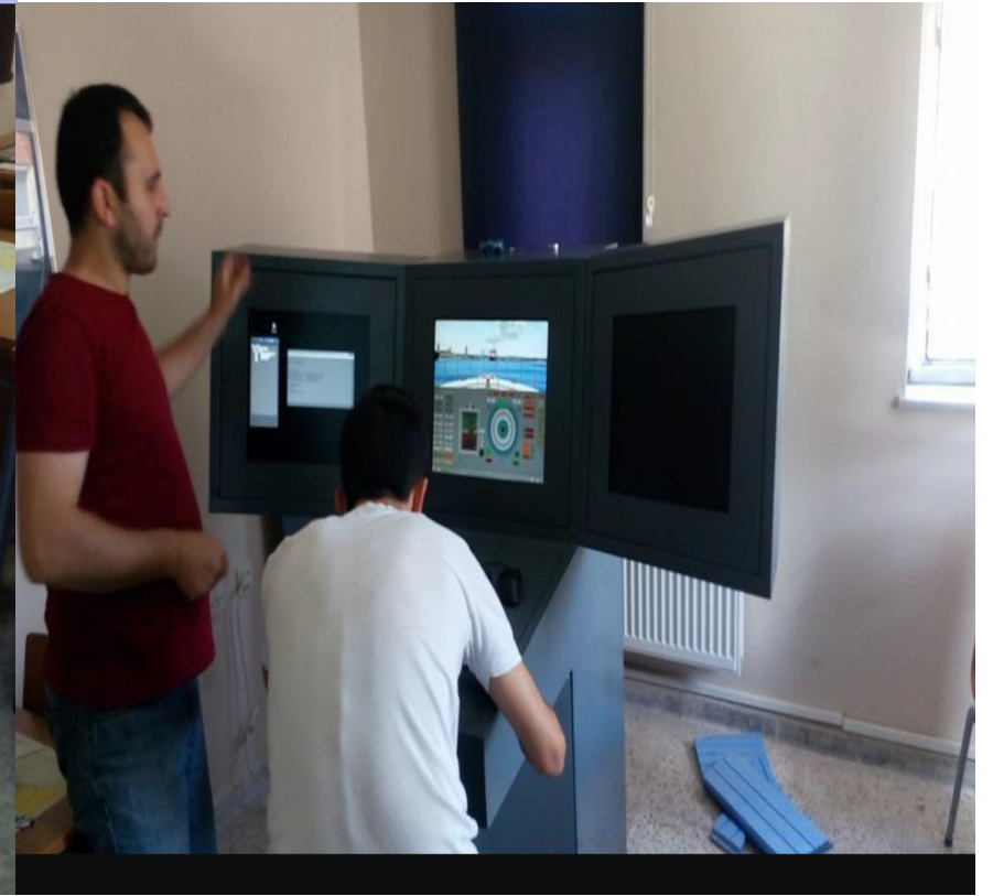
Arpa Radar Simülatorü