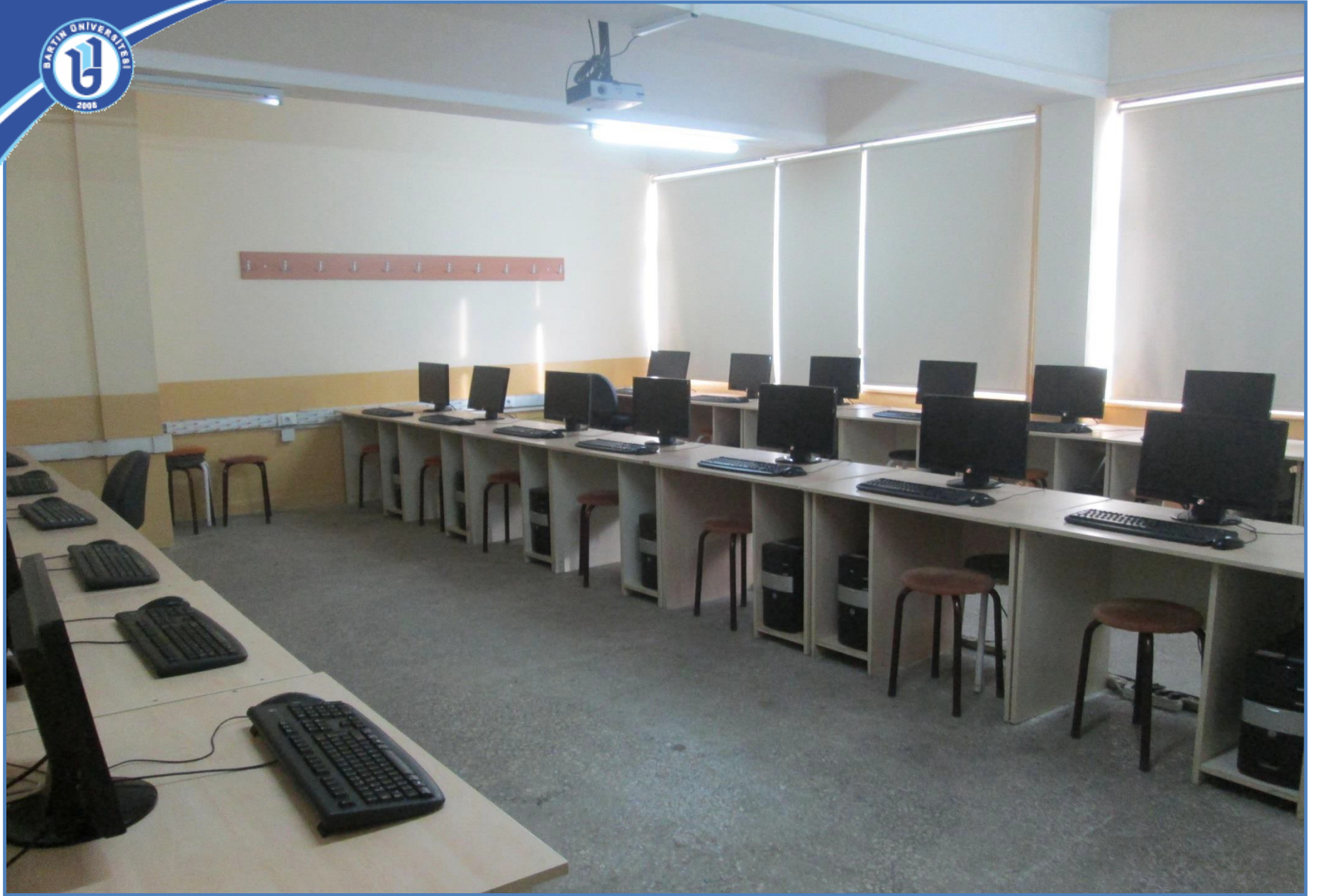
Bilgisayar Laboratuvarı II