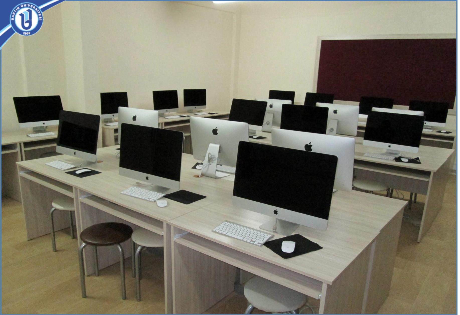
Bilgisayarlı Tasarım Atölyesi