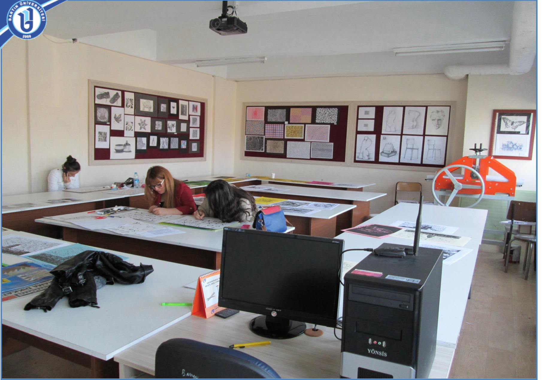
Temel Sanat Atölyesi