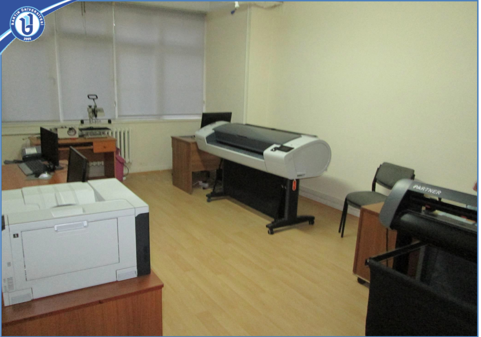
Dijital Baskı Atölyesi