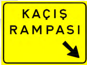
Kaçış Rampasını Gösteren İşaretler