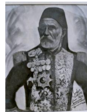
Serdar-ı Ekrem Ömer Paşa