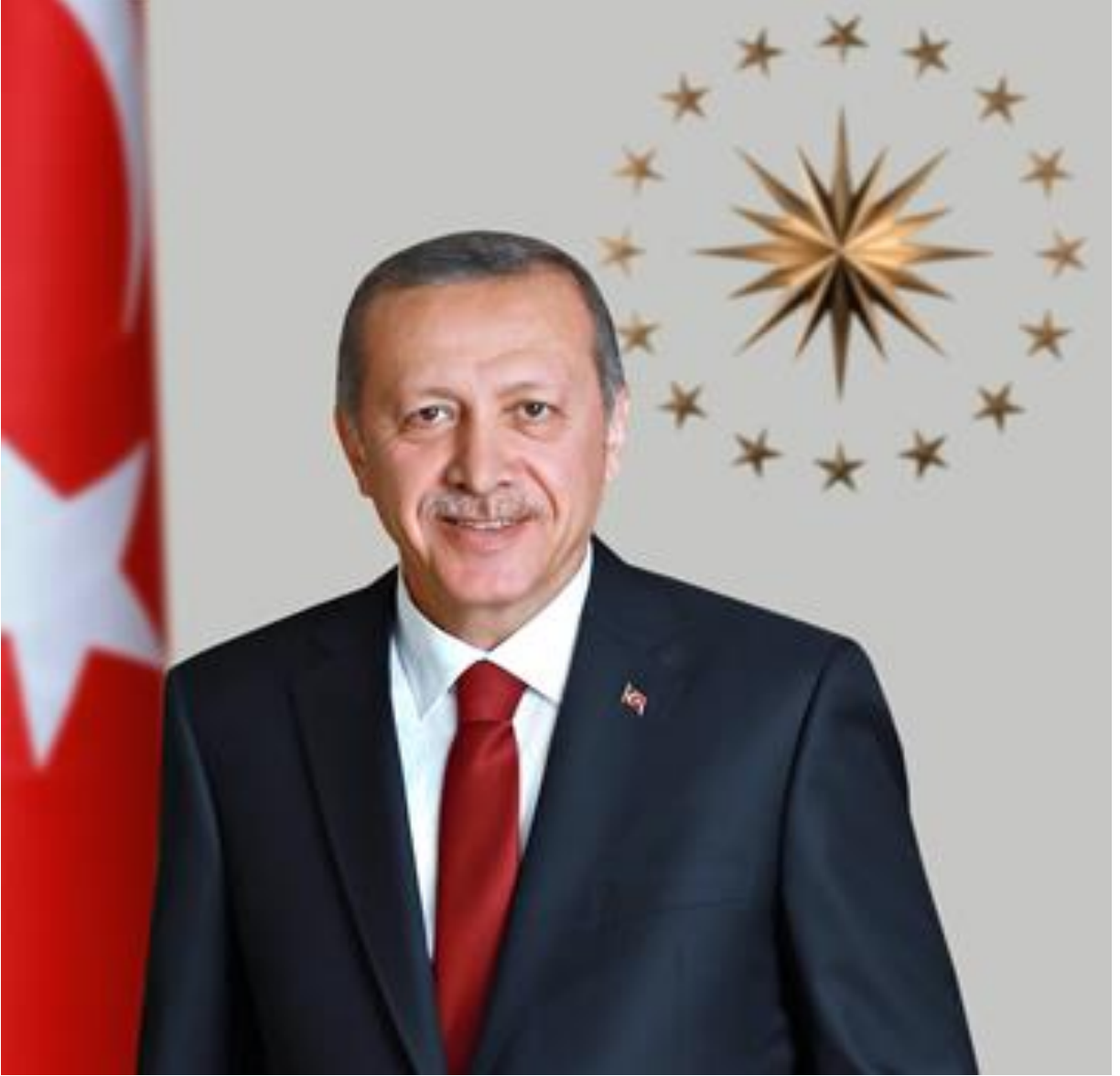
Recep Tayyip Erdoğan Cumhurbaşkanı