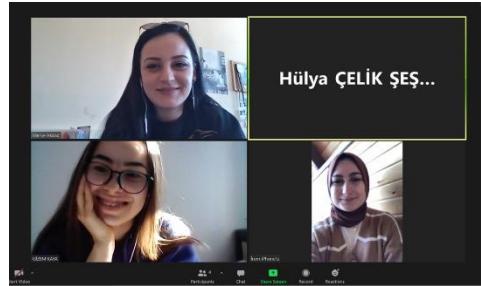
EK 4: PG5.5.2. Kalite kültürüne yönelik yapılan eğitim faaliyetleri sayısı