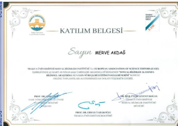
EK 2: PG2.3.2. Öğretim elemanlarının aktif katılım sağladığı bilimsel etkinlik sayısı(Kanıtlar)