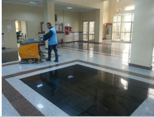
2. Az su harcayan elektrikli temizleme aracı (Bartın Üniversitesi, Türkiye)