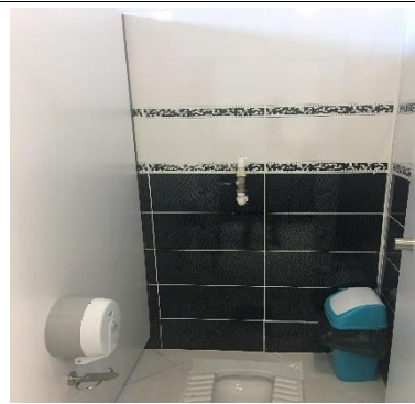
1. Kampüs Binalarında Su Verimli Cihazların Kullanımı (Debi Düşürücü)