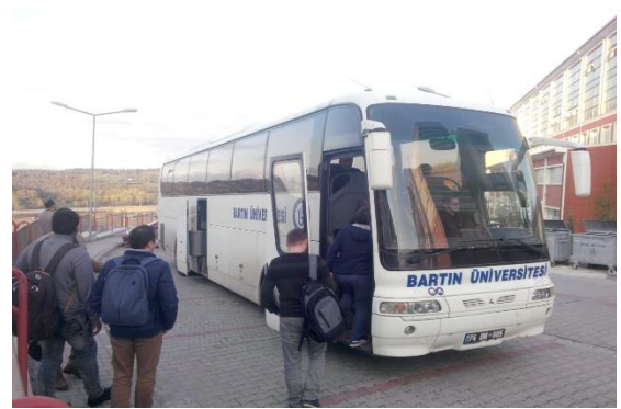
Ücretsiz servis imkanı (Bartın Üniversitesi, Türkiye)