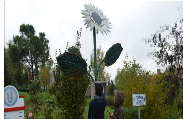
Telefon vb. Şarjlı ayçiçeği güneş paneli bank