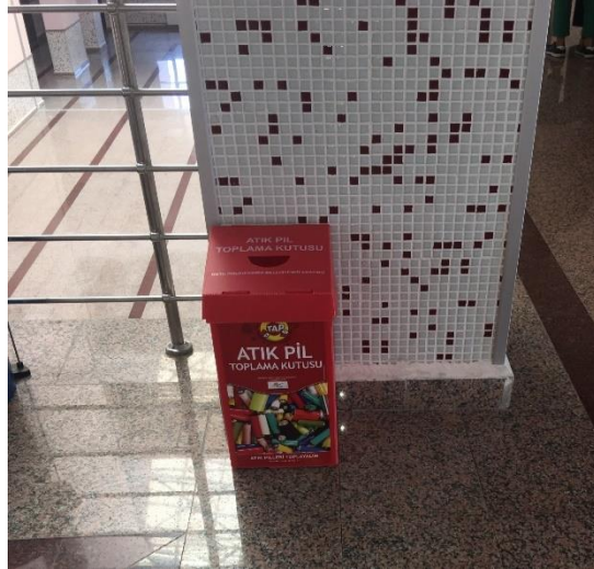
Atık geri dönüşüm programı (Bartın Üniversitesi, Türkiye)