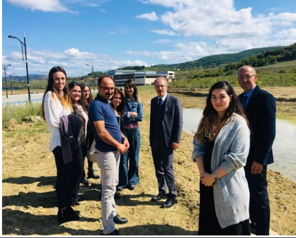
1. Binalardan gelen yağmur suyu hatları biriktirilmiş ve doğal gölet bina projesi tamamlanmıştır.