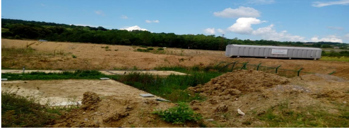
Paket arıtım sistemi (Bartın Üniversitesi, Türkiye)

Atık suların arıtılması için kampüslerde biyolojik arıtma tesisi bulunmaktadır.