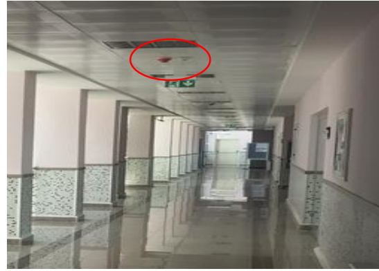
Otomatik yangın alarm Sensor Sistemi