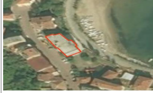
Ağdacı, Kutlubey, Ulus and Kurucaşile (Bartın Üniversitesi, Türkiye)