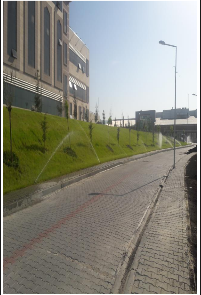
2. Yeşil alanlarda otomatik bir sulama sistemi bulunduğundan, uygun saatlerde uygun saatlerde sulanarak su tasarrufu sağlanmıştır