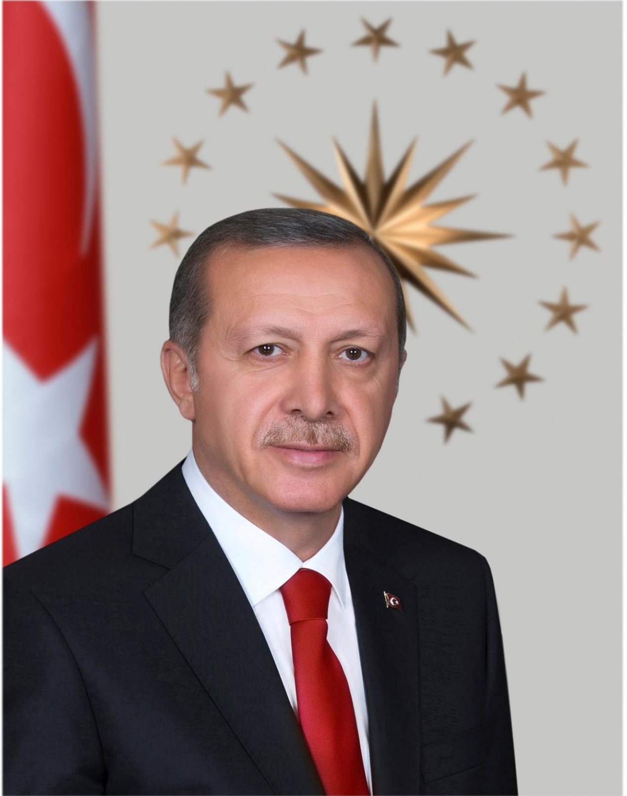
Recep Tayyip ERDOĞAN