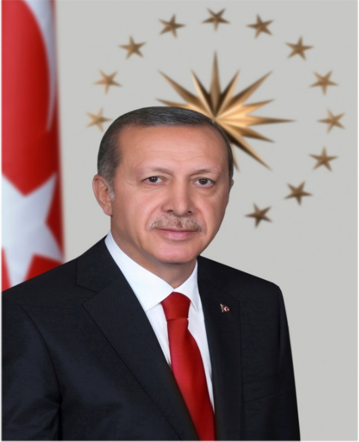
Recep Tayyip ERDOĞAN Cumhurbaşkanı