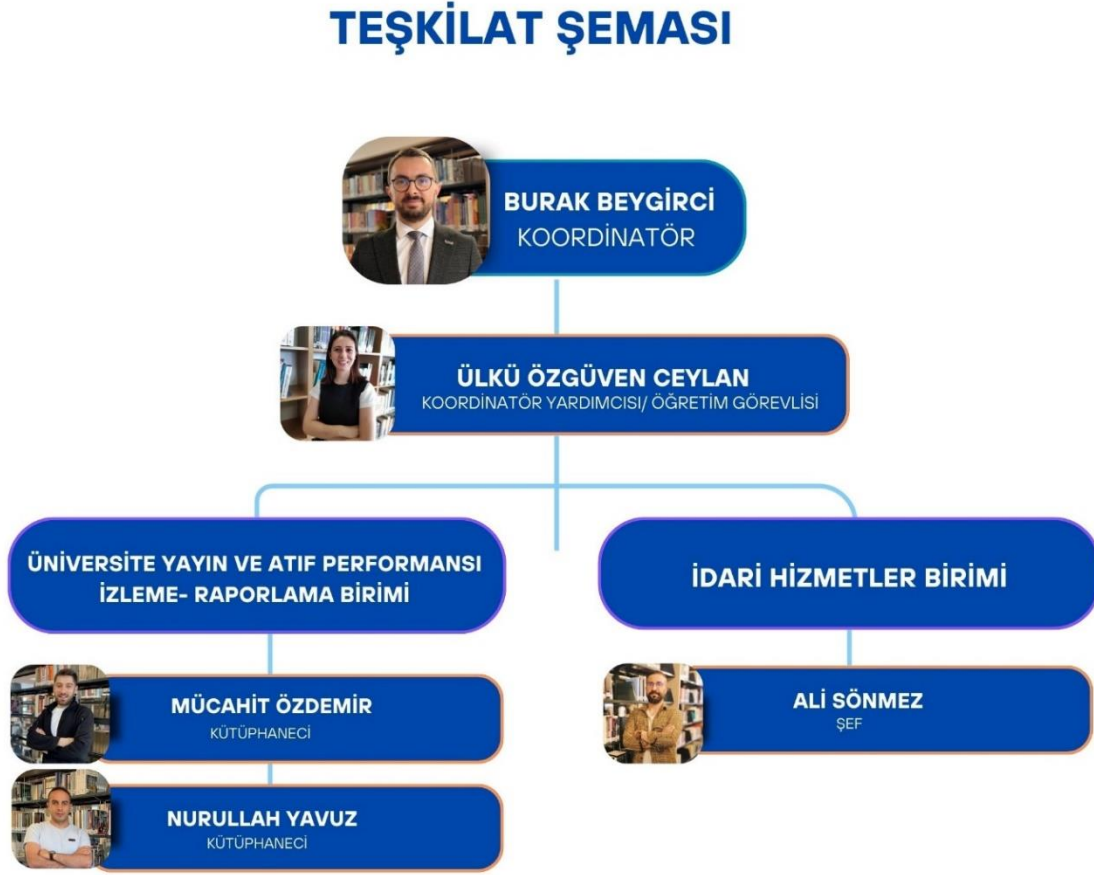
Şekil 1. Bilimsel Yayınlar Koordinatörlüğü Teşkilat Şeması