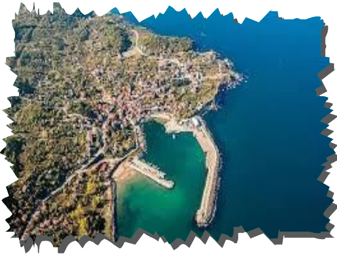
Amasra Kurucaşile Limanı

Kuşları yaşam alanlarında gözlemlemek ve tanımlamak faaliyetleridir (Şekercioğlu 2002). Çıplak gözle veya dürbün ve teleskop gibi görsel bir iyileştirme cihazı aracılığıyla, kuş sesleri dinleyerek yapılabilmektedir. Gözlem yapılırken doğayla uyumlu, dikkat çekmeyen renklerde bir giysi tercih edilmelidir. Güneş ışınlarından ve yağmurdan koruyacak bir şapkada kullanılmalıdır. Özellikle gözlemi kaydetmek çok önemlidir bu nedenle her kuş gözlemcisinin bir kayıt defteri ve birkaç kalemi olması gerekir. Bu deftere görülen kuş türleri, kuş gözleminin yapıldığı zaman ve yer, gözlemi yapan kişilerin adları yazılır. Gözlemlenen kuşun büyüklüğü, gaga şekli, kuyruk uzunluğu, tüy özellikleri, ayakları, örtüşü, uçuş şekli gibi bilgiler not edilir. Bartın ilinde kuş gözlemciliğini Gazhaneden başlayarak Boğaz istikametine giden ırmak boyunca yapabilmek mümkündür. Bunlara ek olarak Bartın Limanı, Amasra Kurucaşile Limanları, Çobanoğlu göleti kuş gözlemi yapabileceğimiz elverişli alanlardandır.