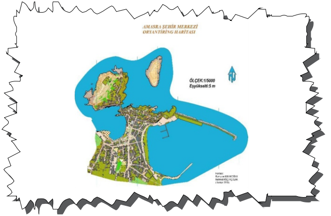
Amasra Şehir Merkezi