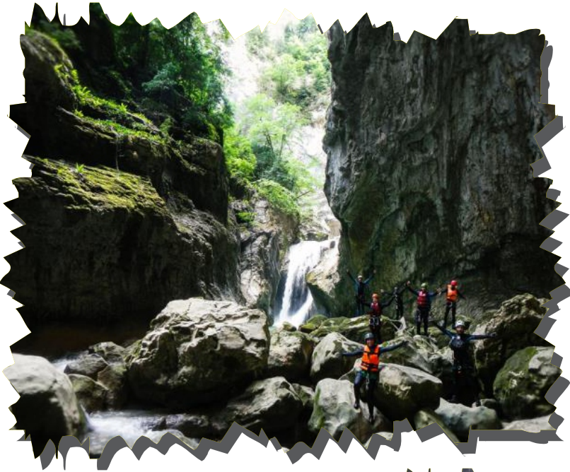
Bartın Ulukaya Kanyonu

Kanyon geiş sporu, kanyonlar boyunca doęa etkinliklerini ieren bir macera sporudur. Tırmanma, yzme, yryř ve daęcılık gibi aktiviteleri ierir ve doęal engelleri ařmayı, akıntılı su geiřleri yapmayı ve zorlu arazilerde ilerlemeyi gerektirir. Kanyon sporunu yapmak iin ncelikle gvenlięi saęlamak nemlidir. Sonra, doęru ekipmanı seip kullanarak rotayı planlayın. Grup halinde hareket ederek birlikte ilerleyin ve gvenlik kurallarına dikkat edin. Doęal vreyi koruyarak ve doęa kurallarına uyarak sporunuzu gerekleřtirin. Bartın'da kanyon geiři iin potansiyel alanlar arasında Ulukaya Kanyonu , Karedere Kanyonu bulunmaktadır. Bu blgeler doęal gzelliĐler ve zorlu rotalar kanyon geiři iin idealdir.