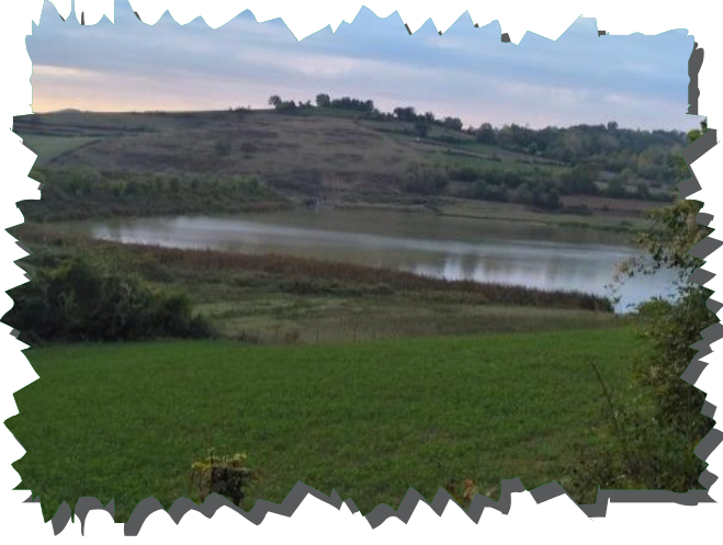
Çobanoğlu Göleti Kuş Gözlemciliği