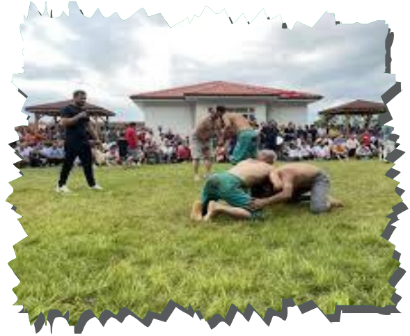
203. Geleneksel Yanaz Köyü Karakucak Güreşleri