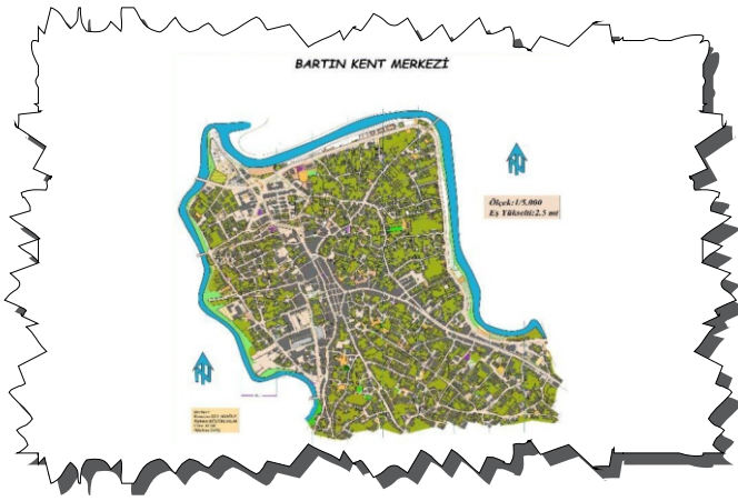
Bartın Şehir Merkezi

Harita yardımı ile yön bulmayı içeren, zamana karşı yapılan bir spordur. Farklı arazi koşullarında yapılabilir de, genellikle ormanlık arazide yapılması tercih edilmektedir. Oryantiringde sporcular kendilerine verilen yarışma bölgesinin haritasında belirtilmiş hedeflere sırasıyla ve en kısa sürede ulaşmaya çalışırlar. Kontrol noktalarında turuncu-beyaz bayraklar bulunmaktadır. İki hedef arasında hangi yolu izleyeceğine yarışmacı kendi karar verir. Amaç hedefleri en kısa sürede tamamlamaktır. Yarışmacıların birbirini izlememesi için genellikle birkaç dakika arayla çıkış verilir. Yarışmacılar parkur boyunca karşılaşırsalar dahi birbirlerini izlemeleri yasaktır. Bartın ilinde oryantiring yapılabilecek yerler; Bartın şehir merkezi, Amasra şehir merkezi, Balamba Tabiat Parkı, Uluyayla'dır bu bölgelere dair oryantiring haritaları çıkarılmıştır.