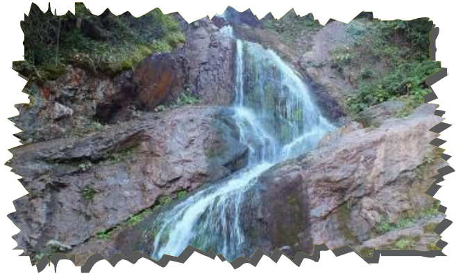
Aksu ayı Őelalesi (Bartın Ulus-Kumluca)