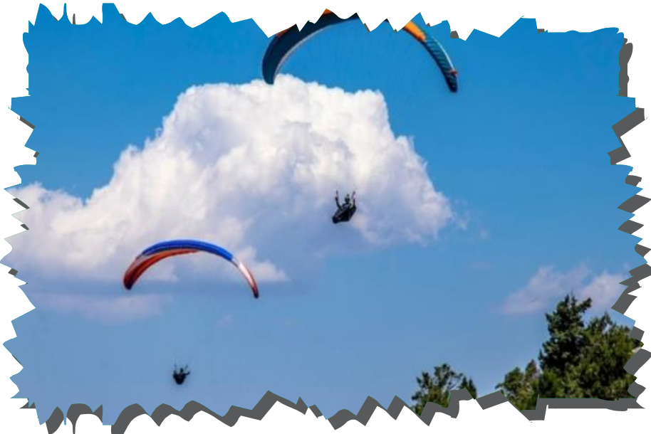
Bozköy Tepesi Yamaç Paraşütü