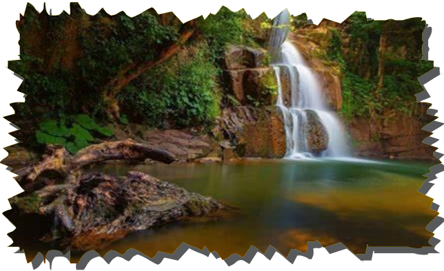
Glderesi (ambu) Őelalesi (Bartın-KuruaŐile)