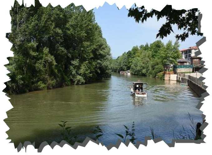
Bartın Irmağı Kuş Gözlemciliği

Kuşları yaşam alanlarında gözlemlemek ve tanımlamak faaliyetleridir (Şekercioğlu 2002). Çıplak gözle veya dürbün ve teleskop gibi görsel bir iyileştirme cihazı aracılığıyla, kuş sesleri dinleyerek yapılabilmektedir. Gözlem yapılırken doğayla uyumlu, dikkat çekmeyen renklerde bir giysi tercih edilmelidir. Güneş ışınlarından ve yağmurdan koruyacak bir şapkada kullanılmalıdır. Özellikle gözlemi kaydetmek çok önemlidir bu nedenle her kuş gözlemcisinin bir kayıt defteri ve birkaç kalemi olması gerekir. Bu deftere görülen kuş türleri, kuş gözleminin yapıldığı zaman ve yer, gözlemi yapan kişilerin adları yazılır. Gözlemlenen kuşun büyüklüğü, gaga şekli, kuyruk uzunluğu, tüy özellikleri, ayakları, örtüşü, uçuş şekli gibi bilgiler not edilir. Bartın ilinde kuş gözlemciliğini Gazhaneden başlayarak Boğaz istikametine giden ırmak boyunca yapabilmek mümkündür. Bunlara ek olarak Bartın Limanı, Amasra Kurucaşile Limanları, Çobanoğlu göleti kuş gözlemi yapabileceğimiz elverişli alanlardandır.