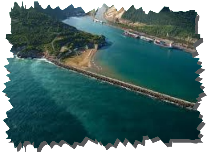
Bartın Limanı Kuş Gözlemciliği