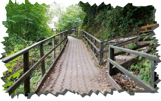
Kuşkayası Yürüyüş Parkuru