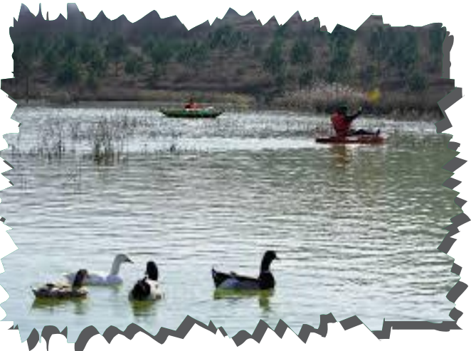
Bartın Üniversitesi Kutlubey Yerleşkesi Gölet Alanı Kano