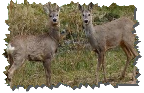
Küre Dağları Milli Parkı Yaban Hayatı Fotokapan Görüntüleri