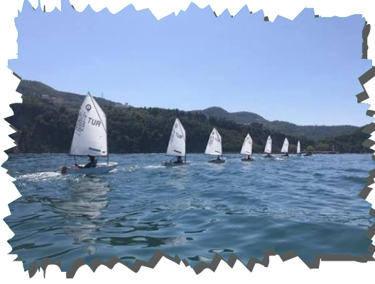
Amasra Limanı Yelken

Yelken sporu rüzgarın yardımıyla hareket eden bir deniz aracı vasıtasıyla yapılan su sporudur. Bu spor, yelkenli tekneleri kontrol etmeyi, rüzgarın yönünü ve şiddetini ustaca kullanmayı içerir. Tarihi oldukça eski olan yelken sporu, hem rekabetçi yarışlar hem de sakin deniz gezileri için tercih edilen bir aktivitedir. Yapılma alanları Bartın ili nezdinde kano sporu ile benzerlik gösterir. Yelken sporunda özellikle Amasra öne çıkmaktadır. Geçmiş dönemlerde Amasra Yelken Kulübü bünyesinde büyük çaplı organizasyonlar düzenlenmiş olup bugün amatör yelkencilere eşsiz doğası ile ev sahipliği yapmaktadır. Büyük Kızılkum Plajı, Mugada Plajı, Güzelcehisar Plajı, Amasra, Çakraz, İnkum, Bozköy, Hisarköy, Karaman, Tarlaağızı, Göçkün ve Kurucaşile plajları yelken sporu için oldukça elverişli alanlardır.