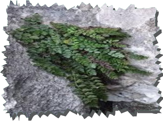
Bartın Üniversitesi Tarafından Küre Dağları Sınırları İçerisinde Keşfedilen Eğrelti Türü

Botanik gözlemciliği "bitkilerin coğrafi yaşam alanlarında gözlemlene ve tanımlama faaliyeti" şeklinde tanımlanabilir. Gözlemin kaydedilmesi çok önemlidir. Gözlemlenen bitkinin büyüklüğü, yaprak biçimi, kalınlık ve rengi gibi bilgiler not edilir. Bu nedenle bir not defteri ve kalem bulundurulması önemlidir. Bitki gözlemlenmek için yapılan seyahatlerin artması ile birlikte bu aktivite son yıllarda çevre örgütlerinin, yerel yöneticilerin ve ulusal basının da dikkatini çekmeye başlamıştır. Bartın ilinde botanik gözlem açısından Kızılkum, İnkumu, Mugada, Göçgün (Amasra), Kapısıyu (Kurucaşile) plajlarında türüne az rastlanan Kum zambağını gözlemleyebilmek bunun yanı sıra ilin eşsiz doğasında ve Küre Dağları Milli park alanı sınırları içerisinde farklı bitkileri de gözlemlenmek mümkündür.