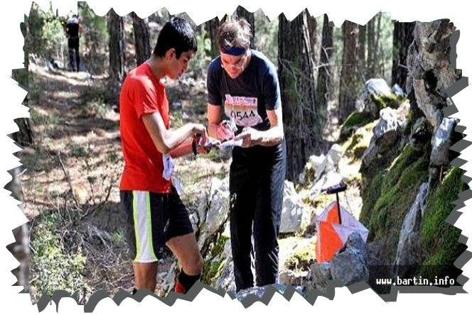
Balamba Tabiat Parkı