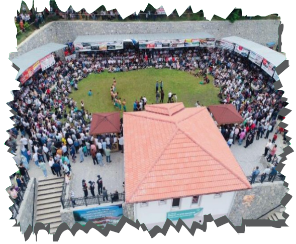
Yanaz Güreş Sahası