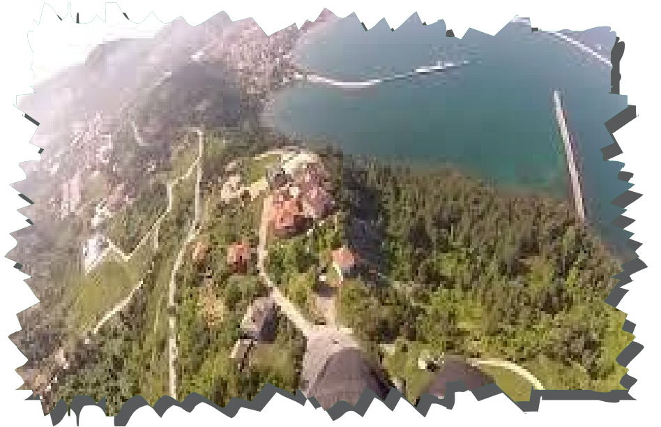
Amasra Yamaç Paraşütü

Yamaç paraşütü; özgürlük ve adrenalin vadeden hava sporudur. Kuş bakışı doğanın tüm renklerine şahit olmak ve heyecanlı dakikalar yaşamak isteyenlerin tercih ettiği bu sporu yapabilmek için profesyonel olma zorunluluğu bulunmaz, lisanslı pilotlar eşliğinde havada süzülürken sadece anı yaşamak yeterlidir. Yamaç paraşütü denilince insanların aklına genellikle serbest paraşüt gelir. Serbest düşüşte bir hava aracı gerekir ve yüksekte salınarak gökyüzünde süzülür, yamaç paraşütünde ise bir hava aracına gerek yoktur. Dağlardan ya da yüksek yamaçlardan belirli bir hız kazanarak atlanır ve gökyüzüne karışılır. Bozköy Tepesi ile Delikli Şili yakınındaki Köyüstü Tepesi yamaç paraşütü denince Bartın ilinde ilk akla gelen en elverişli bölgelerdir. Birçok doğa sporuna olanak sunan bu bölgelerde düzenlenen yamaç paraşütü eğitimlerinin yanı sıra, rehber eşliğinde atlayışlar da gerekli planlamalar yapılarak profesyonel ekipler eşliğinde gerçekleştirilebilmektedir.